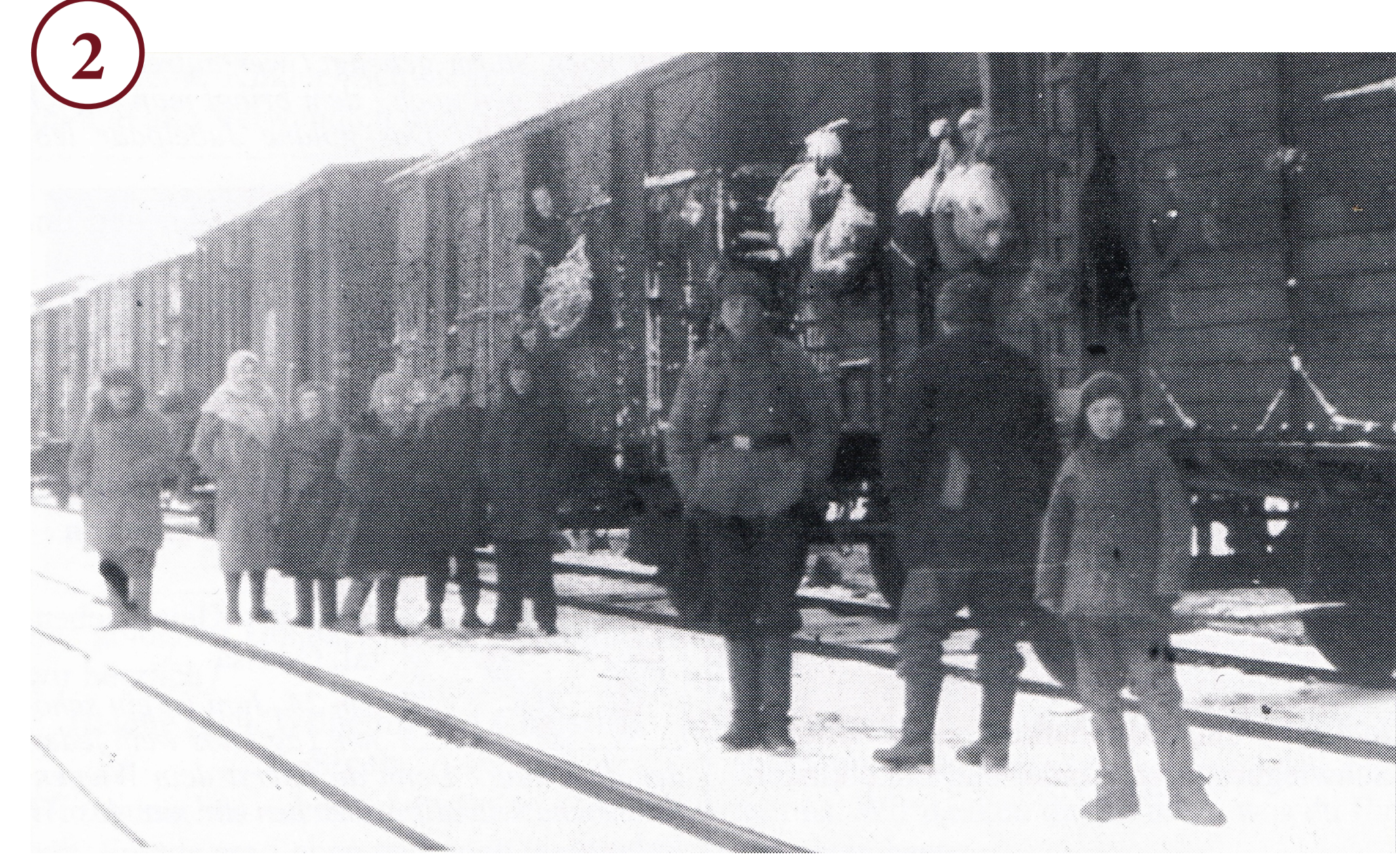
2. Ешелон із репатріантами у Бресті, що прямує до Сибіру, 1945 Eisenbahnzug in Brest mit Repatrianten, die nach Sibirien folgen, 1945

Мит dem Erreichen Polens und der Tschechoslowakei durch die Rote Armee wurde die Frage nach dem Umgang mit den Kriegsgefangenen und umgesiedelten Zivilisten verschiedener Kategorien aktuell. Im rückwertigen Gebiet der nach Westen vorrückenden Fronten der Roten Armee wurden Lager für Repatrianten eingerichtet, durch die aus Lagern befreite Kriegsgefangene, „Ostarbeiter“ und zivile Flüchtlinge in die UdSSR zurückkehren konnten. Männer im wehrfähigen Alter, sowohl Kriegsgefangene, als auch „Ostarbeiter“, wurden aus Auffangslagern militärischen Stellen überstellt, Verdächtige – in Sonderlager des NKWD. Für den Truppendienst nicht taugliche Männer, Frauen und Kinder sollten nach der Überprüfung im Filtrationslager zu ihren Wohnorten der Vorkriegszeit geleitet werden. Für die Filtration waren 3–5 Tage vorgesehen. Die Vereinbarung zwischen den Verbündeten über den Austausch von Bürgern über die Demarkationslinie wurde am 22. Mai 1945 in Halle unterzeichnet. Die im August aufgestellten sowjetischen „operativen Repatriierungsgruppen“ wurden unter Mitwirkung der Verbündeten in der britischen, amerikanischen und französischen Besatzungszonen Deutschlands und in Österreich tätig. Bis Ende 1944 wurden an der Staatsgrenze der UdSSR bereits 15 Filtrationslager des NKWD eingerichtet.