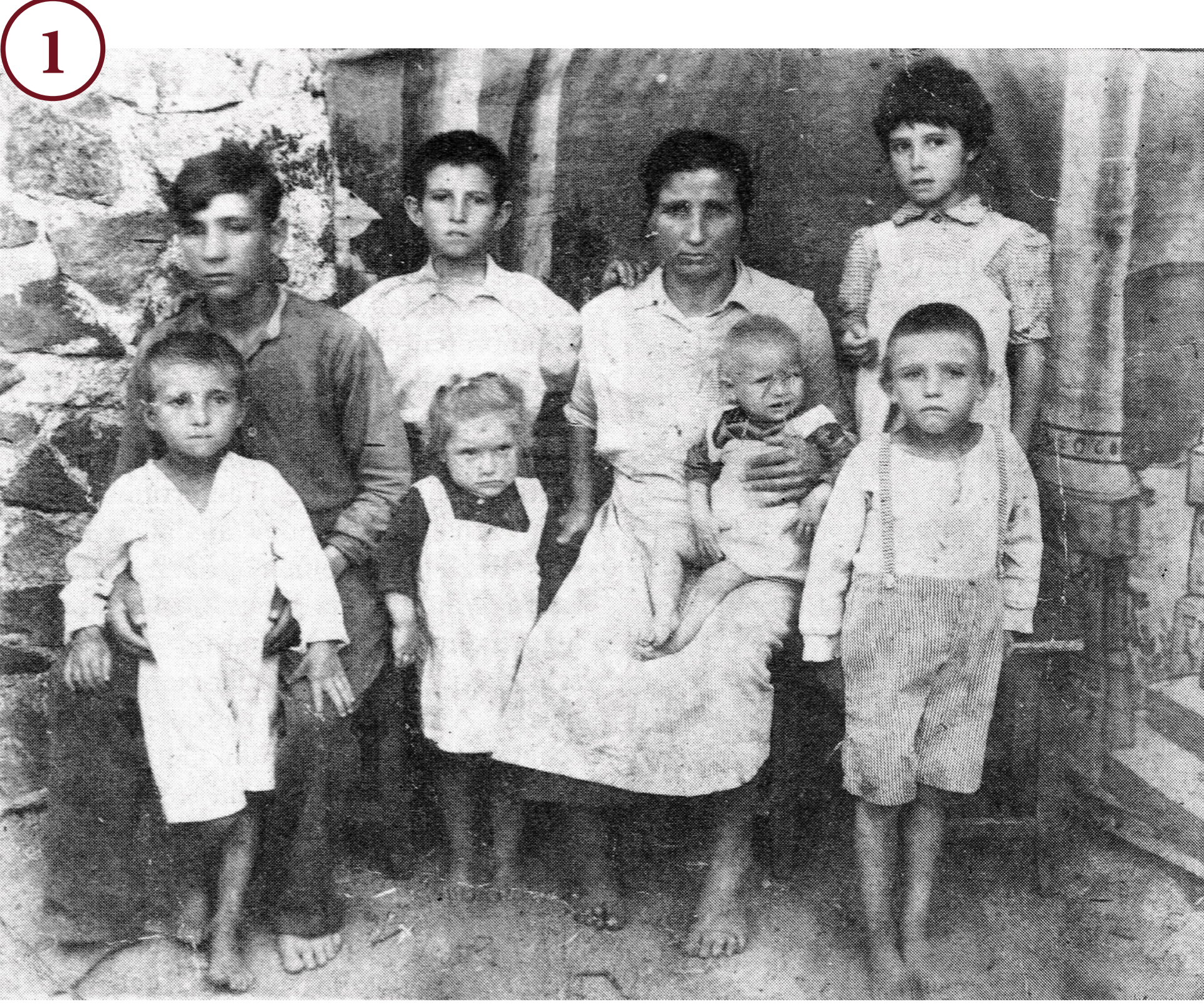
1. Німецька родина з Причорномор'я, репатрійована до СРСР у 1945 р. Deutsche Familie aus dem Schwarzmeergebiet, 1945 in die UdSSR repatriert.

Зі vstupом Червоної армії до Польщі та Чехословаччини актуальним стало питання поведження з військово-полоненими, цивільними переміщеними особами різних категорій. У тилу фронтів Червоної армії, що просувалися на захід, були створені табори для репатріантів, через які звільнені з таборів військово-полонені, «остарбайтери» і цивільні біженці могли повернутися до СРСР. Чоловіків призовного віку, як полонених, так і «остарбайтерів», з приймальних таборів передавали до військових органів, тих, що викликали підозру, – до спецтаборів НКВС. Не придатних до строївої служби чоловіків, жінок і дітей передбачалося після перевірки у фільтраційному таборі відправити до місць довоєнного проживання. На фільтрацію передбачалося 3–5 днів. Угода між союзниками про обмін громадянами через пункти на демаркаційній лінії була підписана 22 травня 1945 р. у Галле. Створені у серпні радянські «оперативні групи з репатріації» за сприяння союзників проводили свою роботу у британській, американській і французькій зонах окупації Німеччини і в Австрії. Наприкінці 1944 р. на державному кордоні СРСР вже було створено 15 фільтраційних таборів НКВС.