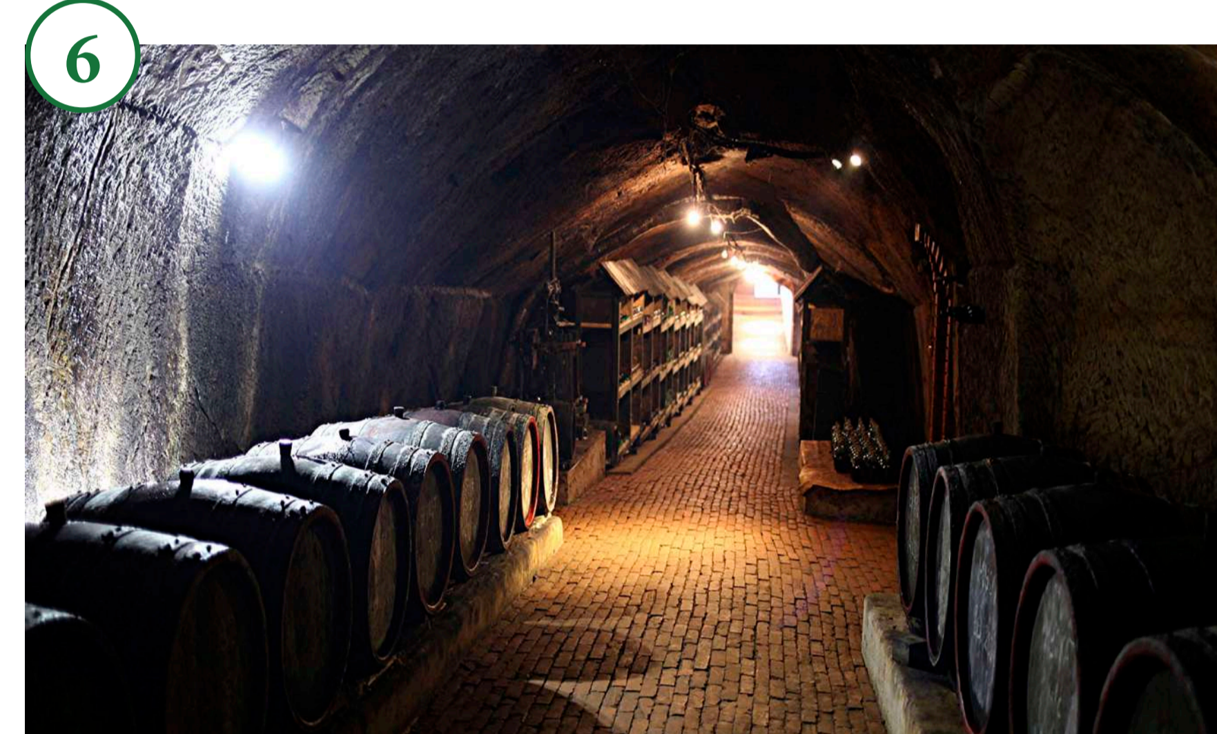
6. Винні підвали у селі Берегове Weinkeller in Berehowo

За патентом імператора Йосифа II (21 вересня 1782 р.) німців-колоністів вербували в Австрії та в німецьких регіонах на Рейні для розвитку малих міст. У XVIII–XIX ст. в Ужгороді (Унгвар), Хусті, Рахові (Рахау), Свалєві (німці з Галичини), Перечині з'явилися ремісничі вулиці або колонії для збільшення населення цих відсталих у своєму розвитку, колись значущих укріплених містц. Іншою причиною був зростаючий попит на предмети повсякденного користування, викликаний поліпшенням економічного становища населення. Наявність сировини та дешевої робочої сили дозволили фахівцям з Австрії та Німеччини налагодити обробку металу в Шелєстовому, Фрідріхсдорфі, Тур'їх Реметах, переробку деревини – в Кобилицькій Полянї, Великому Бичкові, Свалєві, Перечині, Тур'ї Бистрій, Ужгороді, Буштині, обробку шкір – у Хусті.