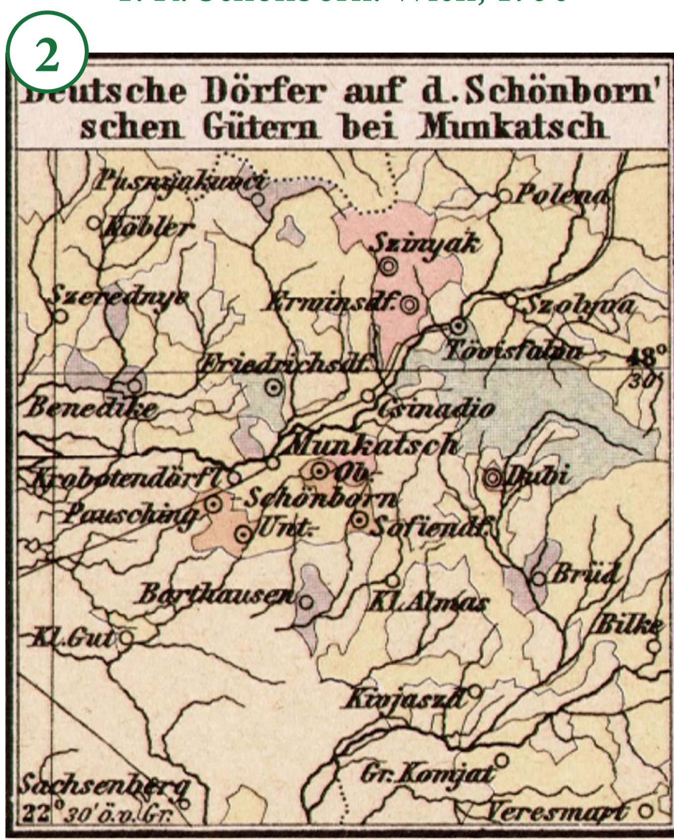
2. Німецькі поселення на землях графів Шенборнів поблизу Мукачєва. 1890 Deutsche Dörfer auf den Schönbornschen Gütern bei Munkatsch. 1890

1. Переселенський патент графа Ф. К. Шенборна. Відень, 1730 Auswanderungspatent des Grafen F. K. Schönborn. Wien, 1730