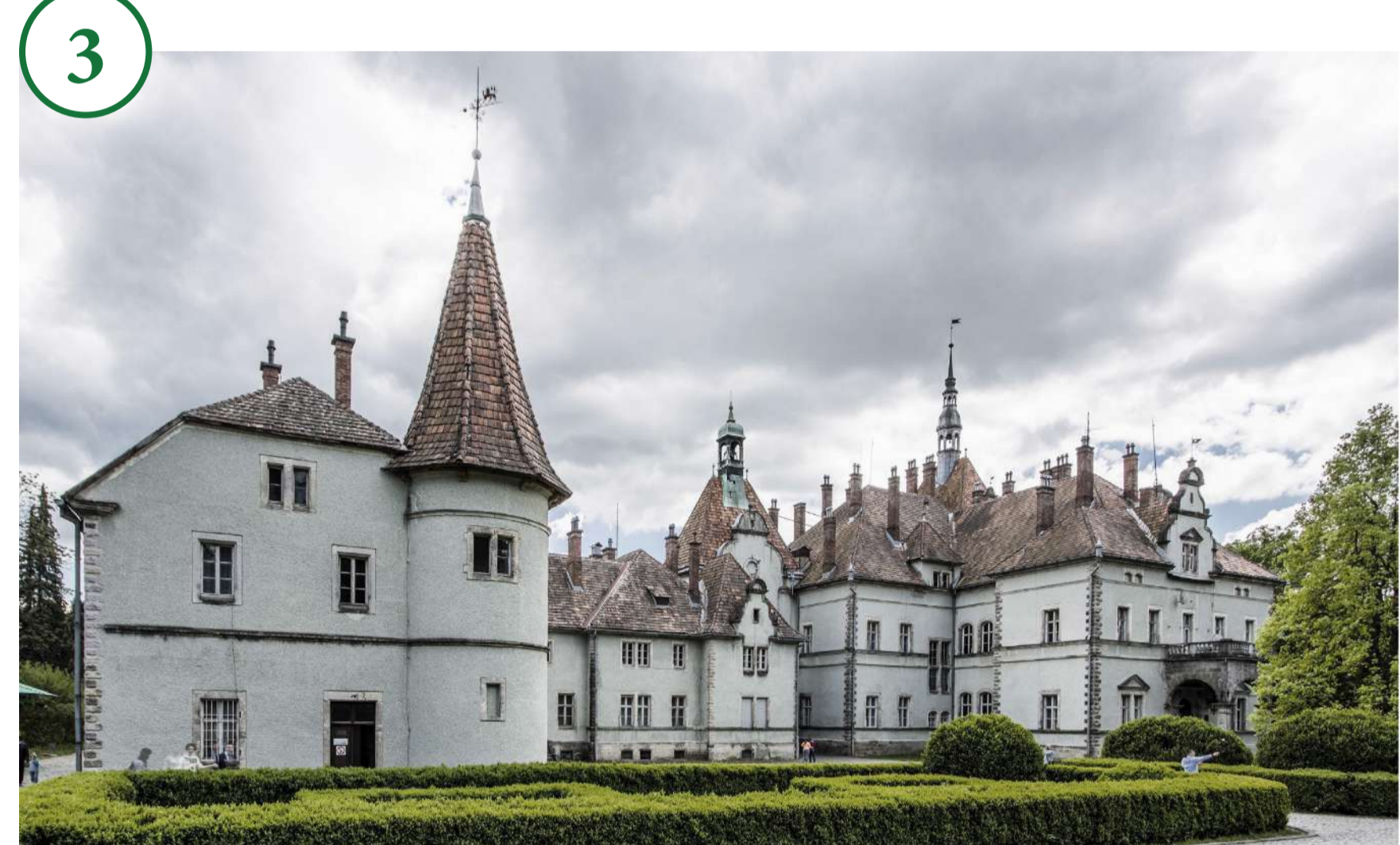
4. Вулиця в Шенборні (колишньому Унтер-Шенборні) Straßensicht von Schönborn (ehem. Unter-Schönborn)

3. Колишній замок Берєгвар графів Шенборнів, з 1946 р. – санаторій «Карпати» в Мукачівському районі Beregwar, ehemals Schloss der Grafen Schönborn, seit 1946 Sanatorium „Karpaty“ im Rayon Mukatschewo