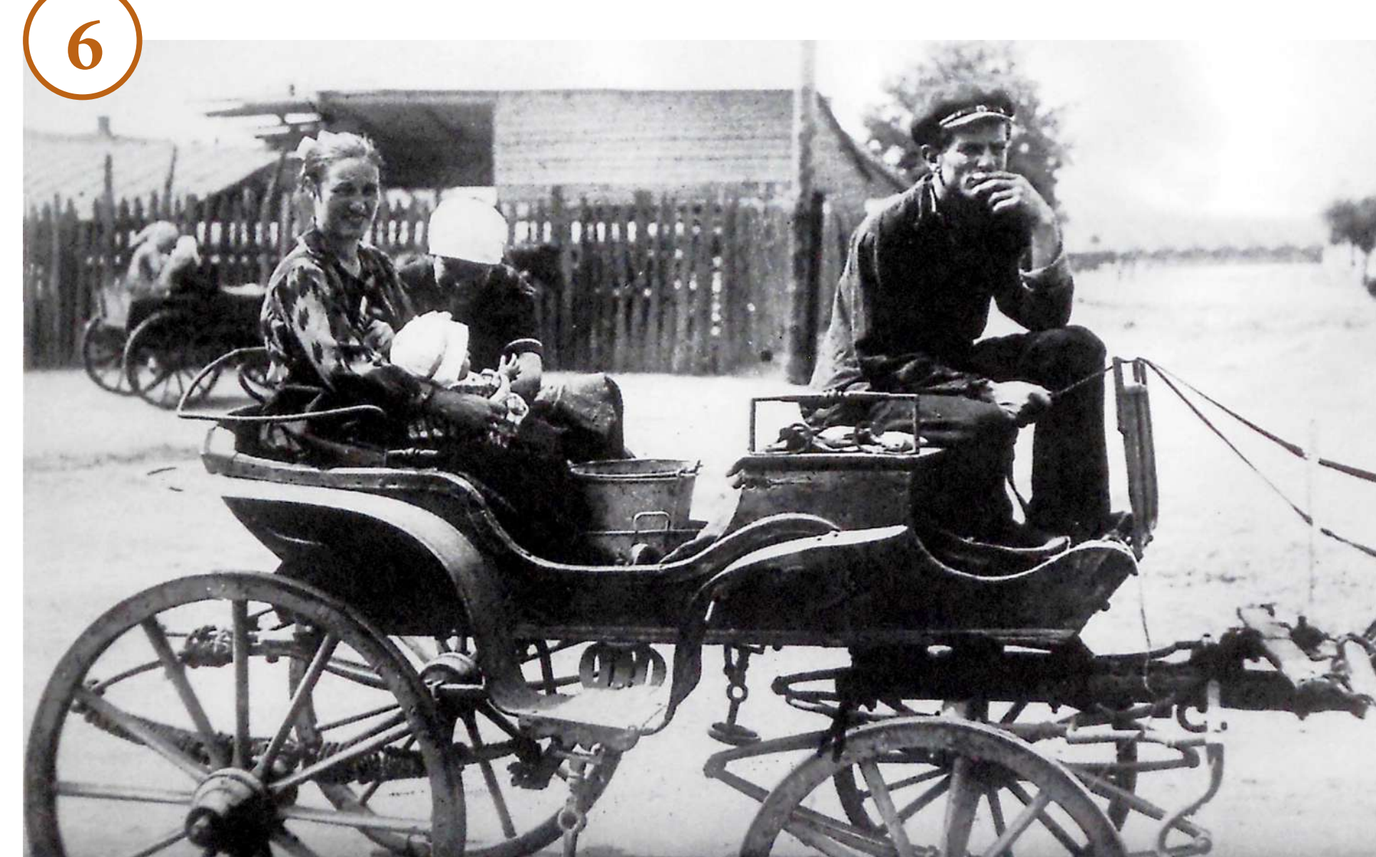
Mennonitischer leichter gefederter Wagen „Droschke“. Anfang 20. Jh. Kam häufig in Kolonisten-Wirtschaften vor. Wurde in viele Kolonien gebaut. Während des Bürgerkrieges wurde der Wagen „Tatschanka“ von den Machno-Anhängern genutzt.