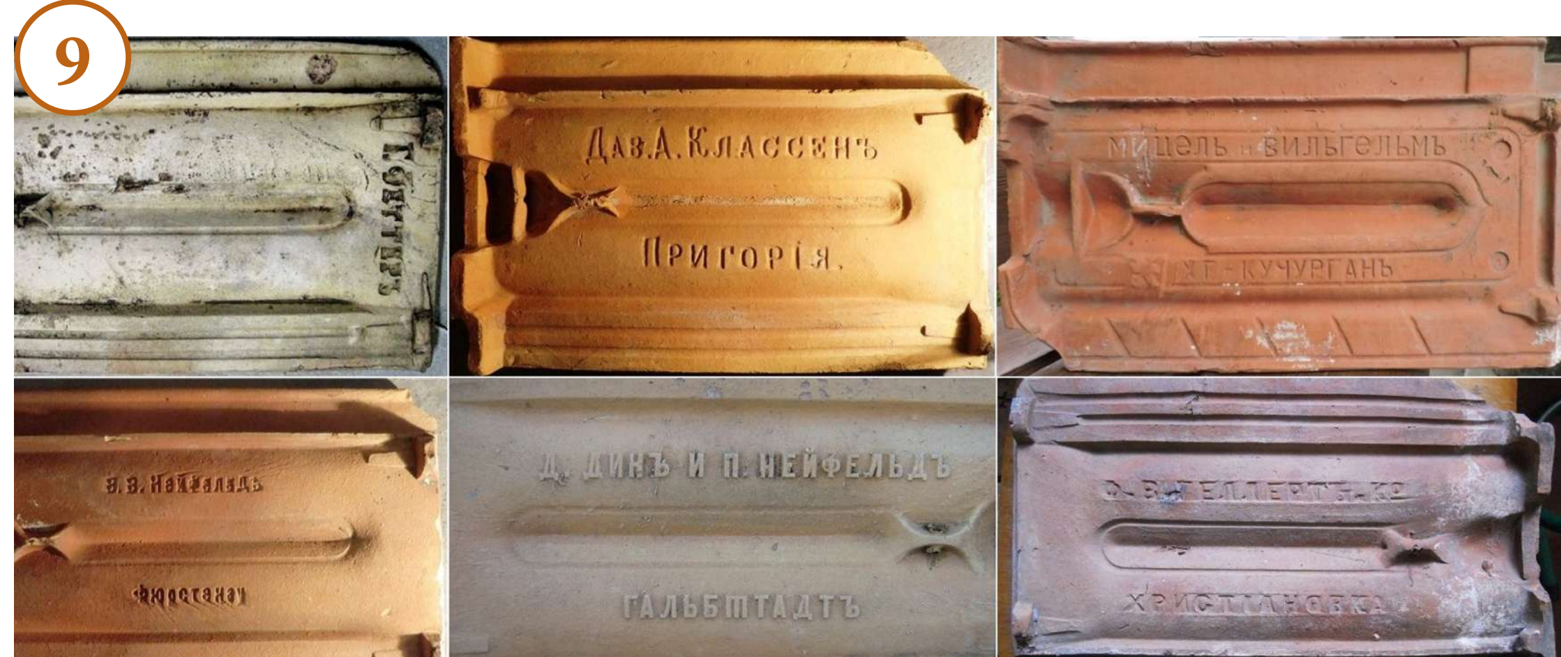
8. Верстат для виготовлення черепиці. XIX ст. Арцизький районний історико-краєзнавчий музей, Одеська область Ziegelpresse. 19. Jh. Historisch-heimatkundliches Rayonmuseum Arzis, Gebiet Odessa

Die Existenz einer Deutschen Straße in Rowno, Harkow, Nikolajew, Simferopol, Feodosia und andernorts in früheren Zeiten weist auf deutsche Stadtbewohner hin. Das Entstehen deutscher Handwerkerkolonien in Städten zu Beginn des 19. Jahrhunderts war durch völliges Fehlen einzelner Handwerke und Gewerbe (Odessa, Feodosia) oder die Notwendigkeit, bestimmte Gewerbe zu entwickeln, zum Beispiel, die Herstellung von Tuch für den Bedarf der Armee (Harkow, Poltawa, Kremenschug, Konstantinograd u.a.) bedingt. Dazu wurden deutsche Tuchweber und andere benötigte Meister aus dem Ausland eingeladen. In manchen landwirtschaftlichen Kolonien gab es so viele Handwerker, dass ihre Arbeit nicht nachgefragt wurde. Ihnen wurde die Umsiedlung in nahegelegene Städte gestattet.