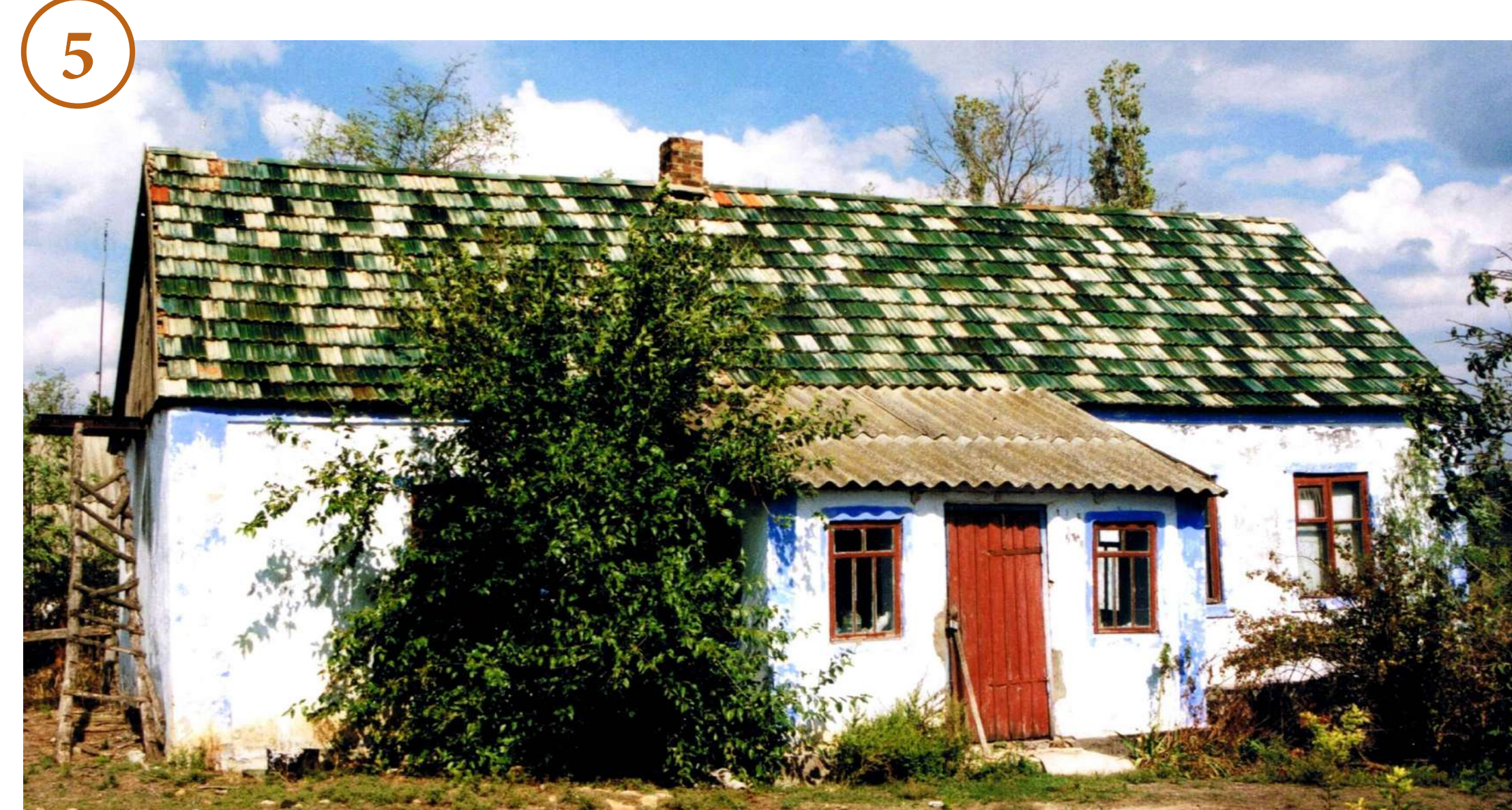
5. Будинок колоніста, покритий кольоровою глазурованою черепицею (Миколаївська область) Kolonistenhaus, gedeckt mit kolorierten glasierten Dachziegeln (Gebiet Nikolajew)

Ремісники орієнтувалися на попит населення. У містах виготовляли меблі, одяг, предмети домашнього вжитку, годинники, музичні інструменти. У колоніях були затребувані столяри, теслі, шорники, ковалі, стельмахи, бондарі, ткачі, чинбарі, гончарі, пічники, майстри, що будували льохи, млини, колодязі, цистерни для зберігання води, а також майстри, які виготовляли цеглу, черепицю, молотильні катки, пряжки та ін. Гуттери колонії Радичів (Чернігівська губернія), основним заняттям яких були ремесла, славилися гончарними виробами, колоністи Ямбурга (Катеринославська губернія) – екіпажами, колонія Вовнянка (Волинська губ.) – сукном. Менноніти Крегери (Розенталь Катеринославської губернії) були відомі своїми годинниками. Меннонітські фури сотнями використовувалися для військових потреб у період Кримської війни. Традиційна для німців черепиця стала «візиткою» колоній, швидко поширившись за їх межі. Лише в 1851 р. молочанськими меннонітами було випалено 2 млн штук цегли і понад 270 тис. штук черепиці.