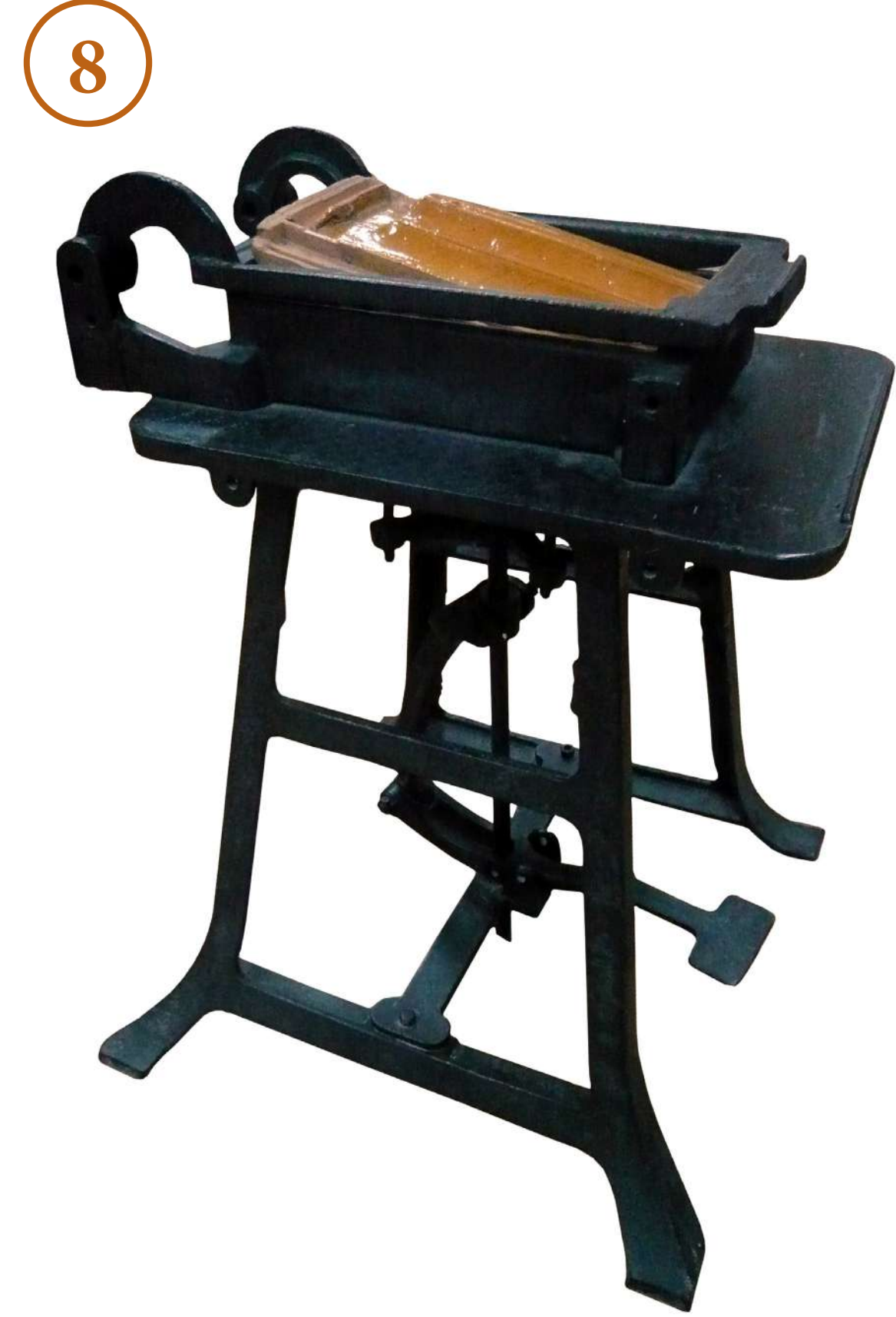
8. Черепиця, виготовлена німцями-поселенцями в різних регіонах України. Кінець XIX – початок XX ст. Dachziegel, die von deutschen Siedlern in verschiedenen Regionen der Ukraine gefertigt wurden. Ende 19. – Anfang 20. Jh.

Невеликі майстерні в колоніях з часом переросли у фабричне та заводське виробництво. Гальбштадт і його дочірнє поселення Ней-Гальбштадт перетворилися на промислові центри молочанських меннонітів. У 1890 р. там працювали 536 слов'ян, 274 іноземці і 43 євреї. Хортиця, Ейнлаге і Розенталь втратили в результаті індустріалізації свій сільський характер. У Хортиці в 1890 р. було лише 44 селянських господарства, а в майстернях і на фабриках працювало 343 іноземці, 519 православних і 147 іновірців.