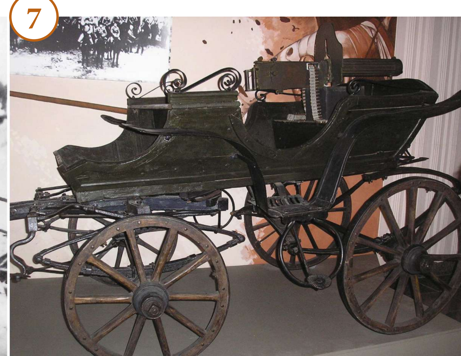
7. Махновська тачанка. Гуляйпільський районний краєзнавчий музей

„Tatschanka“ der Machno-Anhänger. Heimatkundemuseum des Rayons Guljaj-Pole Die Handwerker orientierten sich an der Nachfrage der Bevölkerung. In den Städten fertigten sie Möbel, Bekleidung, Haushaltsgegenstände, Uhren, Musikinstrumente an. In den Kolonien waren Tischler, Zimmerleute, Sattler, Schmiede, Wagenbauer, Böttcher, Weber, Gerber, Töpfer, Ofensetzer, Meister für den Bau von Kellern, Mühlen, Brunnen, Wasserzisternen, für die Anfertigung von Ziegeln, Dachziegeln, Dreschsteinen, Spinnrädern u. a. gefragt. Die Hutterer der Kolonie Raditschew (Gouvernement Tschernigow), die mehrheitlich einem Handwerk nachgingen, waren durch ihre Töpferwaren bekannt, die Kolonisten Jamburgs (Gouvernement Jekaterinoslaw) – durch ihre Kutschen, die Kolonie Rownjanka (Gouvernement Wolhynien) – durch Tuche. Die Mennoniten Kröger (Rosental im Gouvernement Jekaterinoslaw) wurden durch ihre Uhren bekannt. Mennonitische Fuhrwerke wurden während des Krim-Krieges zu Hunderten für militärische Zwecke gebraucht. Die für Deutsche traditionellen Dachziegel wurden zu Visitenkarten der Kolonien und fanden rasch Verbreitung darüber hinaus. Allein 1851 haben Molotschnaer Mennoniten 2 Mio. Ziegel und mehr als 270 Tausend Dachziegel gebrannt.