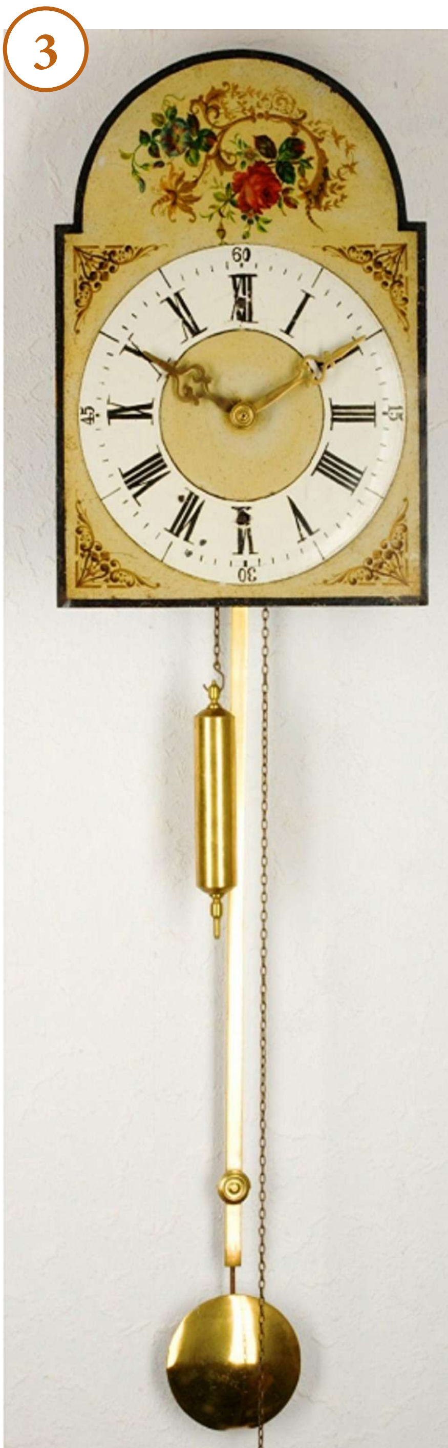
3. Представники родини Крегер з 1804 р. майже 130 років виготовляли годинники. Годинник Крегера (Розенталь, Хортиця). Бл. 1887. Музей історії культури російських німців, Детмольд Angehörige der Familie Kröger haben seit 1804 fast 130 Jahre lang Uhren gefertigt. Die „Krögeruhr“ (Rosental, Chortitza). Ca. 1887. Museum für russlanddeutsche Kulturgeschichte, Detmold

Die Existenz einer Deutschen Straße in Rowno, Harkow, Nikolajew, Simferopol, Feodosia und andernorts in früheren Zeiten weist auf deutsche Stadtbewohner hin. Das Entstehen deutscher Handwerkerkolonien in Städten zu Beginn des 19. Jahrhunderts war durch völliges Fehlen einzelner Handwerke und Gewerbe (Odessa, Feodosia) oder die Notwendigkeit, bestimmte Gewerbe zu entwickeln, zum Beispiel, die Herstellung von Tuch für den Bedarf der Armee (Harkow, Poltawa, Kremenschug, Konstantinograd u.a.) bedingt. Dazu wurden deutsche Tuchweber und andere benötigte Meister aus dem Ausland eingeladen. In manchen landwirtschaftlichen Kolonien gab es so viele Handwerker, dass ihre Arbeit nicht nachgefragt wurde. Ihnen wurde die Umsiedlung in nahegelegene Städte gestattet.