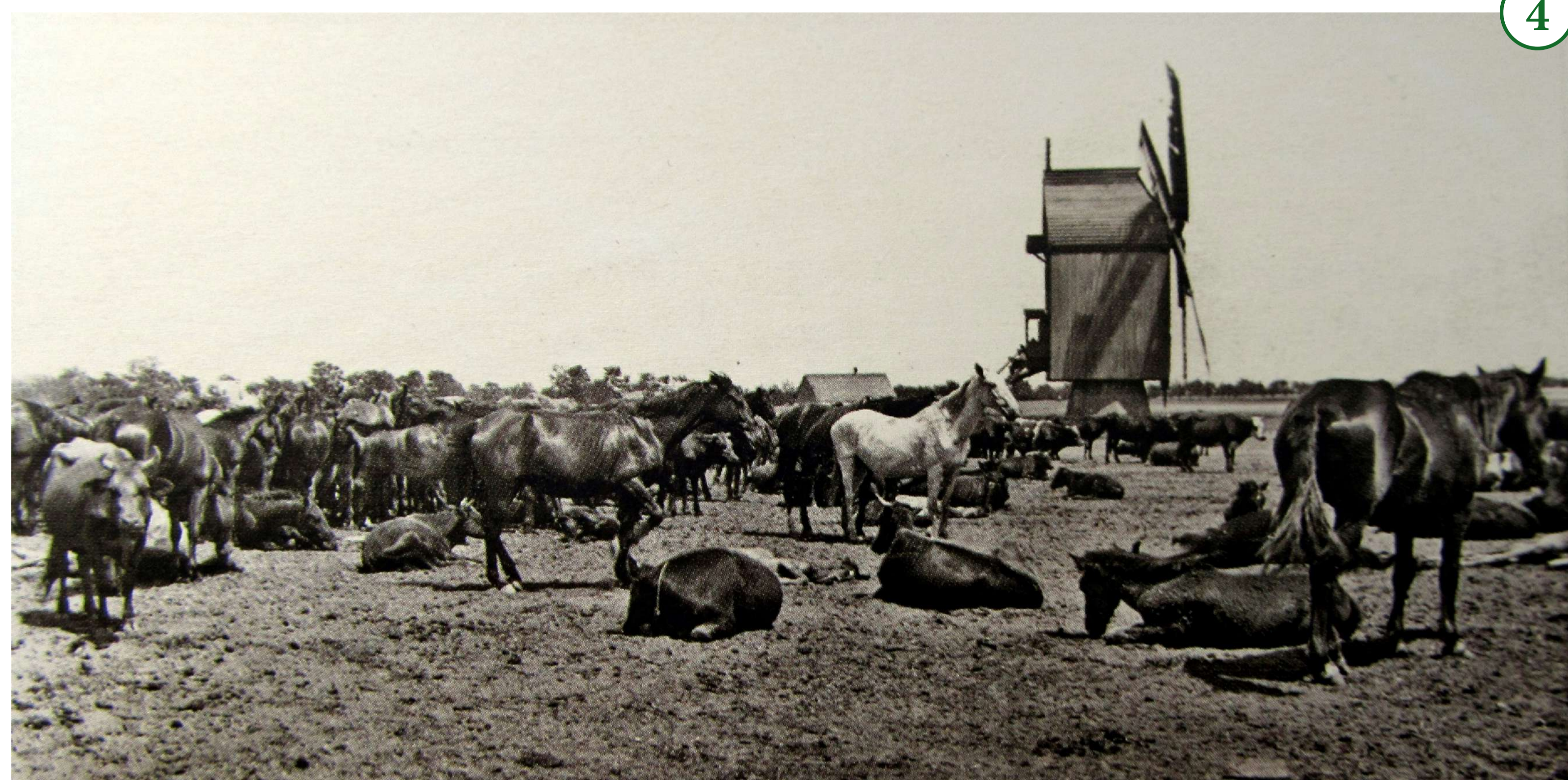
4. Худоба на випасі (Олександрфельд, Таврійська губернія). 1918 Viehweide (Alexanderfeld, Gouvernement Taurien). 1918