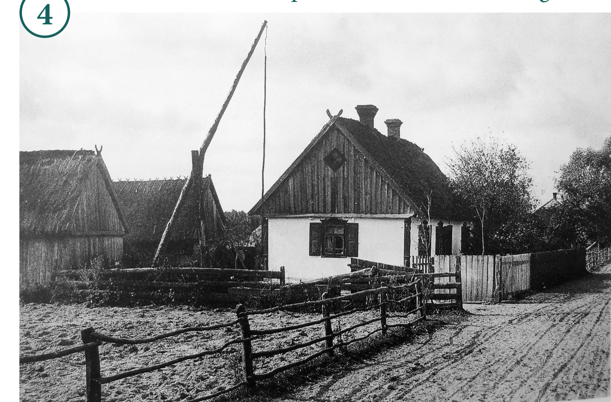
4. Німецьке подвір'я з типовим для Волині колодазем (колонія Альт-Запуст, Луцький повіт). Початок XX ст. Deutsches Gehöft mit typischem für Wolhynien Ziehbrunnen. (Kolonie Alt-Sapust, Bezirk Lutzk). Anfang 20. Jh.

Nach der Agrarreform (1861) haben zahlreiche Bauern, die ihre persönliche Freiheit erlangten, die Besitzungen der Grundherren verlassen. An ihre Stelle rückten nicht selten deutsche Bauern nach, die Land von Grundbesitzern kauften oder pachteten. Nach der Niederschlagung des polnischen Aufstands (1863) hat sich der Zuzug von Umsiedlern vor Jahr zu Jahr verstärkt. Deutsche ließen sich in der Umgebung von Schitomir und Nowograd-Wolynsk nieder, gründeten dort die sog. Waldkolonien, später auch Tochterkolonien im Gouvernement Kiew. 1884 besaßen deutsche Ausländer 93 Tausend Desjatinen Land und pachteten 17 Tausend Desjatinen. Ab Mitte der 1880-er Jahre führte die russische Regierung in 22 West- und Südwestgouvernements Einschränkungen beim Erwerb von Immobilien durch Ausländer ein. Nach 1887 wurden fast 25 Tausend Kolonisten, die preußische Untertanen waren, zu russischen Untertanen. 10 Tausend wanderten 1890 nach Brasilien aus. Zu dieser Zeit zählte die deutsche Bevölkerung des Gouvernements Wolhynien mehr als 155 Tausend Personen.