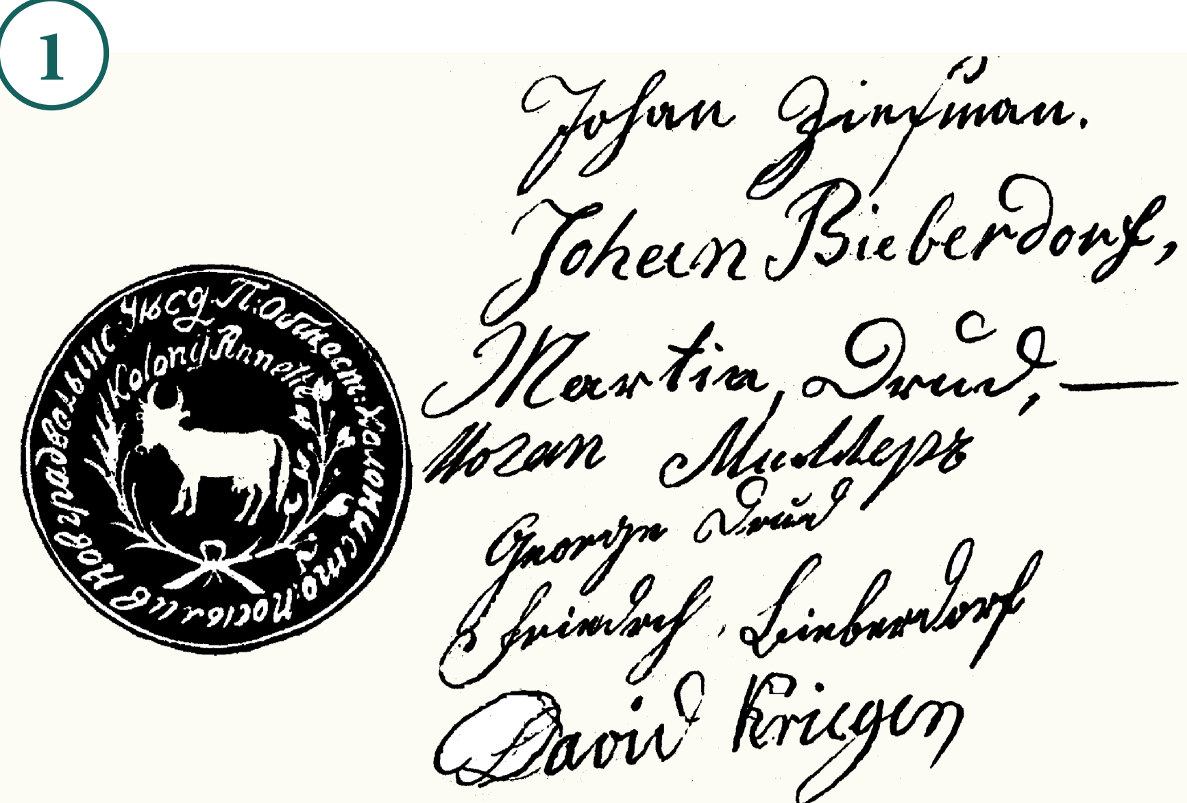
1. Відбиток печатки колонії Анета. 1850. Державний архів Житомирської області Siegelabdruck der Kolonie Annette. 1850. Staatliches Archiv des Gebiets Schitomir

Після 1770 р. німецькі ремісники почали селитися в містах Корець, Рівне, Тучин, Дубно, заснувавши там ткацьке виробництво. Перші євангелічна громада і церква виникли в Корці (1783). Парафіянами були німці-ремісники, запрошені графом Чарторійським для роботи на порцеляновій мануфактурі. Кількість ремісників і робітників у різні роки коливалася від 300 до 1 000 осіб.