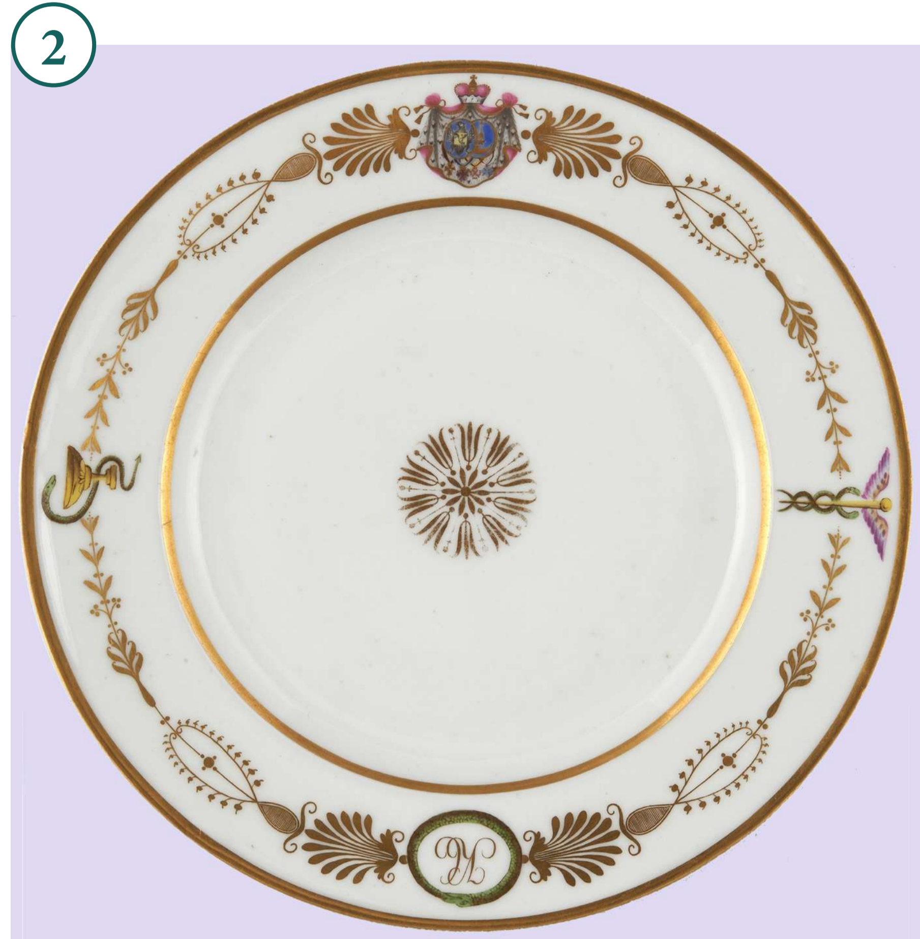
2. Корецька порцеляна. Бл. 1820 р. Музей Королівський замок, Варшава Porzellan aus Korez. Ca. 1820. Museum Königsschloss, Warschau

Німецькі колонії на Волині створювалися на землях поміщиків, які організували переселення і влаштування колоністів, укладаючи з ними довгострокові контракти на оренду ділянок. На землі магната Потоцького біля Бердичева менноніти влаштували колонію Німецький Михалин (1787), яка після поділу Польщі опинилася в Росії. На початку XIX ст. на землі князя Яблонівського поблизу Острога менноніти заснували Карлсвальде і Антоніендорф (Антонівка). Під Дубно оселилися сілезькі дроворуби (Вінцентівка). У 1816 р. переселенці з Померанії під Новоград-Волинським заснували колонії Йозефіна та Анета. З 1833 р. був заснований ряд колоній, які склали Тучинську лютеранську громаду. Розпочалося переселення ткачів у Вільнянку і Тучин. Поблизу Луцька шваби з Галичини заснували Гнідау і ряд інших колоній. Сілезькі лісоруби переміщалися територією Волині, працюючи за наймом на лісопояли. Лише у 1850 р., коли обсяг лісорозробок пішов на спад, вони перейшли до землеробського освоєння болотистих земель, на яких необхідно було проводити корчування й осушення. Ними засновані колонії поблизу Володимира, Луцька та Дубно. До 1860 р. більше 13 тис. меннонітів, лютеран і католиків з Пруссії і губерній, які стали російськими після поділу Польщі, переселилися на Волинь, заснувавши 139 колоній на орендованій землі.