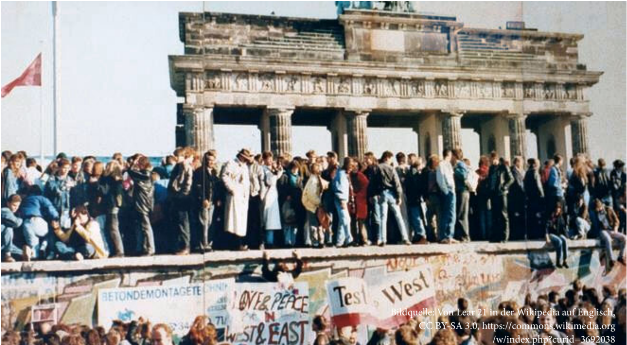
Foto: Von der Nacht des 9. bis zum Morgen des 11. Novembers hielt eine feiernde Menschenmenge die Mauer am Brandenburger Tor besetzt

Am 3. Oktober fand in Kiel, im Norden Deutschlands, zum 30. Mal das sogenannte „Deutschlandfest“ statt, die offizielle Feier zum Tag der Deutschen Einheit. Dieses Fest findet seit 1990 jedes Jahr in einer anderen deutschen Landeshauptstadt statt. Bei einem großen Straßenfest mit vielen Veranstaltungen und Konzerten wird gemeinsam das Ende der deutschen Teilung gefeiert. Der Tag der deutschen Einheit ist der deutsche Nationalfeiertag.