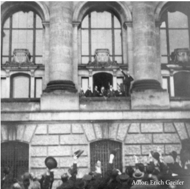
Foto: Philipp Scheidemann bei der Ausrufung der Republik am 9. November 1918

Am 9. November des Jahres 1932 fand auch der Putschversuch der NSDAP unter Adolf Hitler und Erich Ludendorff gegen die Reichsregierung statt, der die Beseitigung der parlamentarischen Demokratie und die Errichtung einer nationalistischen Diktatur zum Ziel hatte. Der Umsturzversuch scheiterte allerdings.