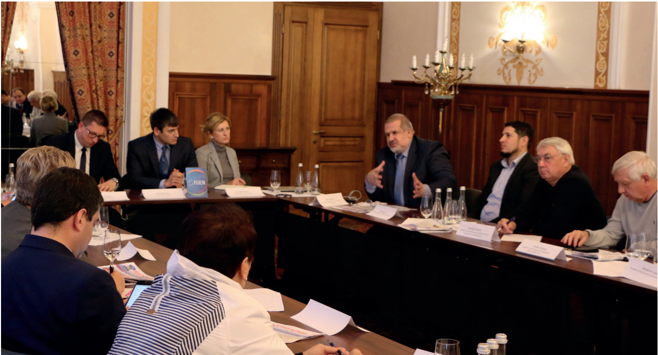
Foto: Präsident der FUEN Vincze Loránt und Vertreter der nationalen Minderheiten der Ukraine

Am 16. Oktober fand ein Arbeitstreffen zwischen dem Präsidenten der FUEN Vincze Loránt und Vertretern der nationalen Minderheiten der Ukraine statt, die Mitglieder der FUEN sind. Während des Treffens wurde die Lage der nationalen Minderheiten in der Ukraine besprochen sowie die Möglichkeit, den FUEN-Kongress 2019, der das größte Treffen der Minderheiten Europas ist, in der Ukraine durchzuführen.