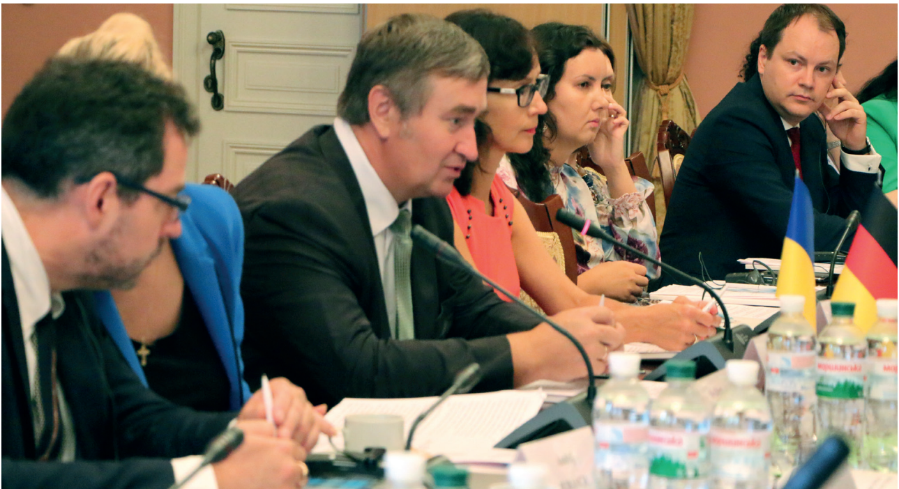
Foto: Vertreter der ukrainischen Delegation