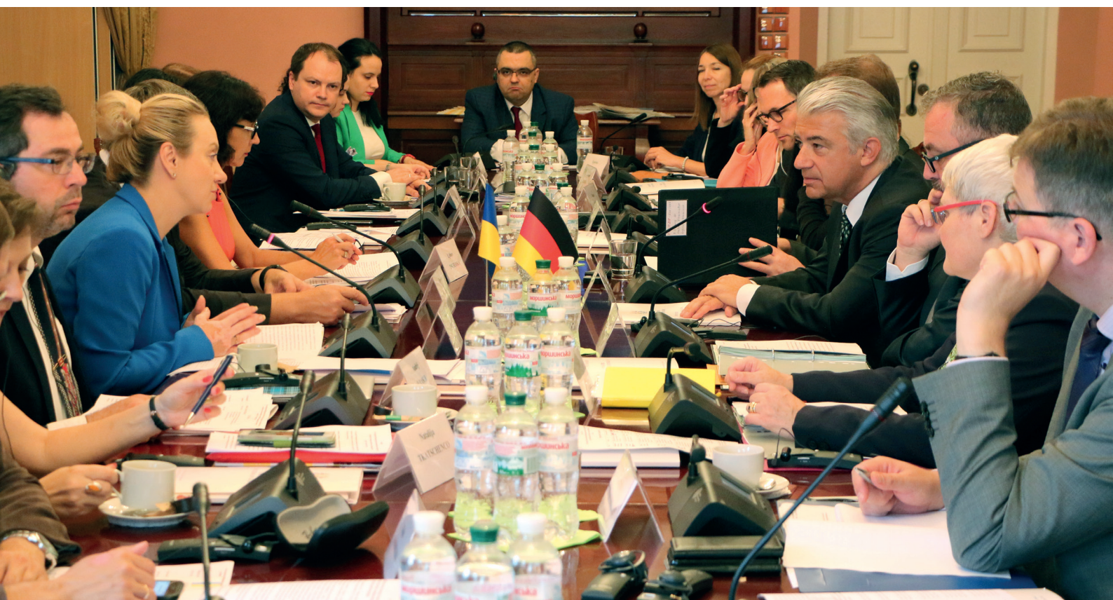
Foto: Vertreter der ukrainischen und deutschen Delegationen