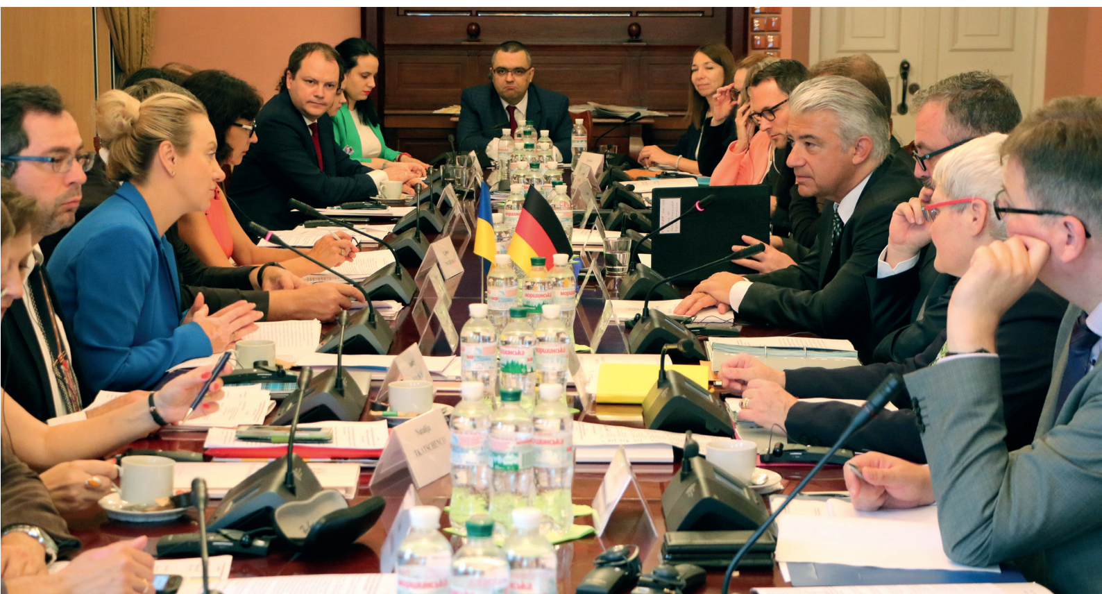
Фото: Представники української та німецької делегацій