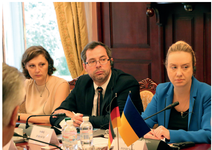
Фото: Представники української та німецької делегацій