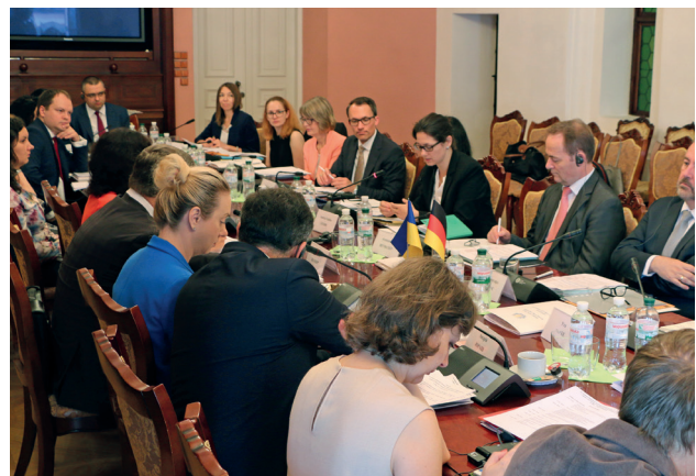
Фото: Представники української та німецької делегацій