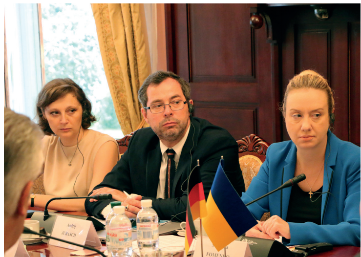
Foto: Vertreter der ukrainischen und deutschen Delegationen