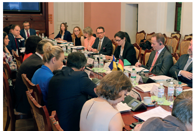
Foto: Vertreter der ukrainischen und deutschen Delegationen