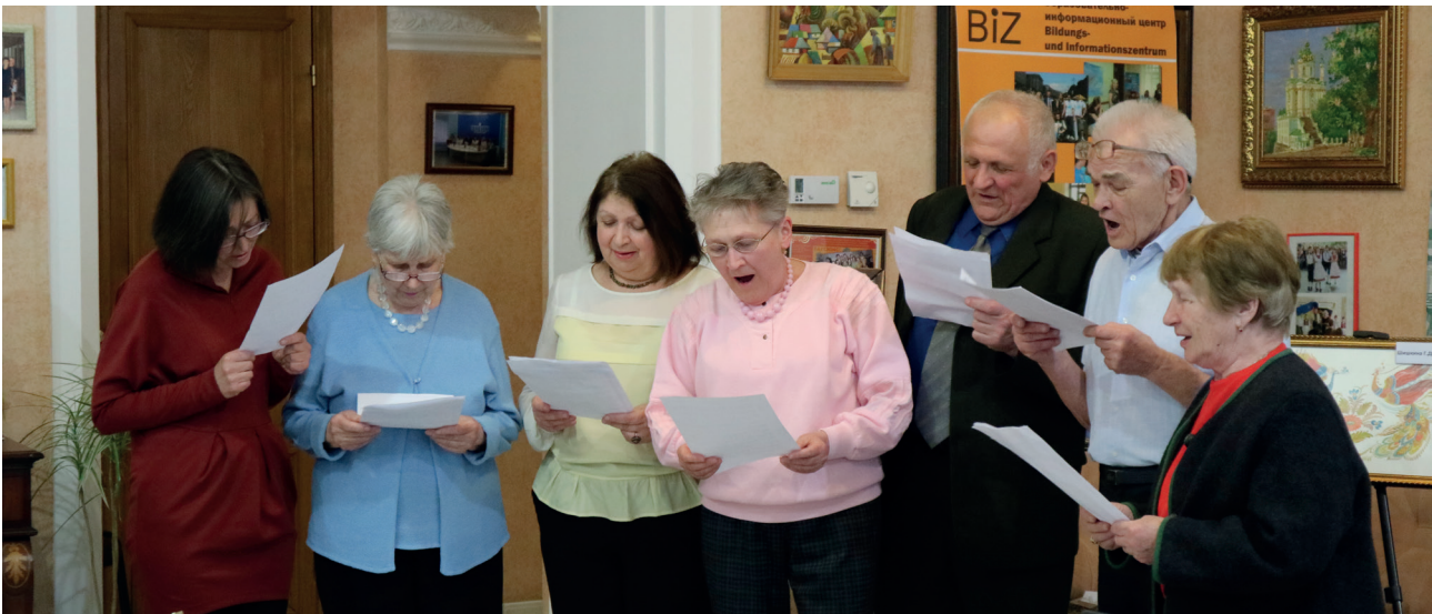
„Wir singen auf Deutsch“ Autorin: Tetjana Kozhynova