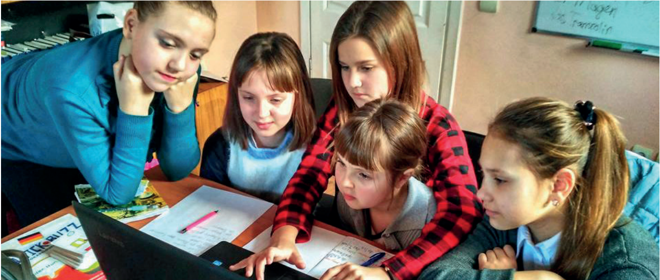
„Deutschunterricht. Digitale Technologien helfen“ Autorin: Larysa Dvornikova