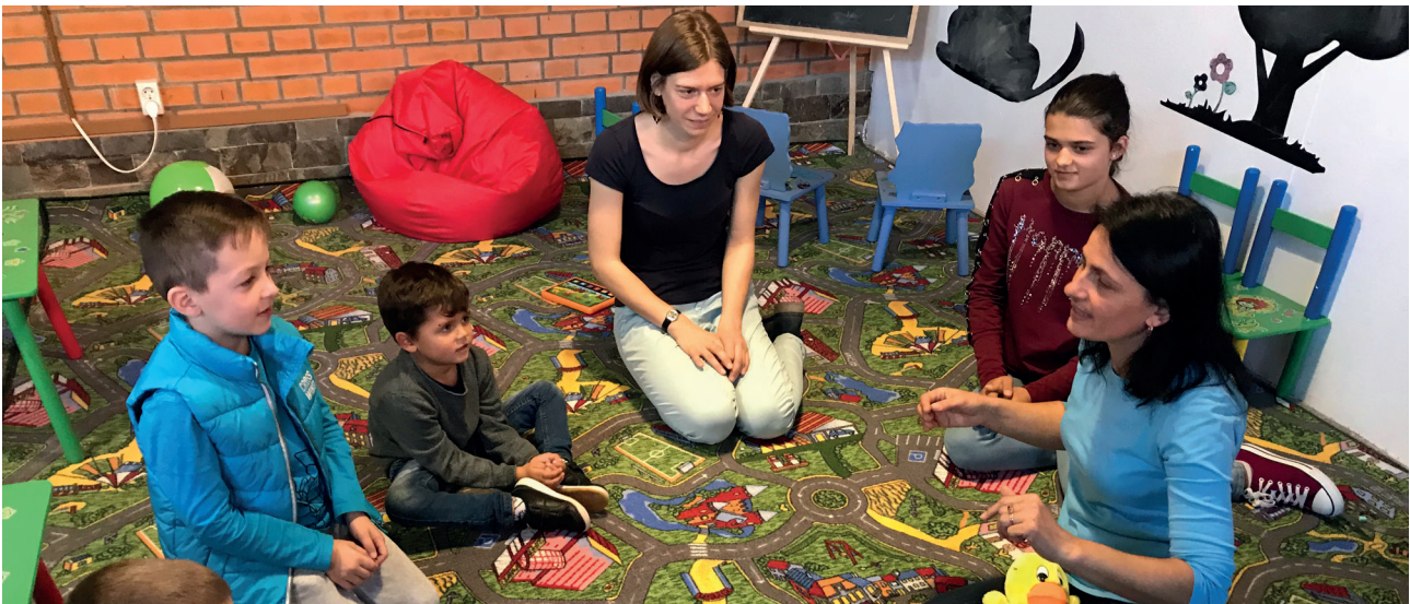
„Wir können klatschen: Klatsch, Klatsch, Klatsch“ Autorin: Julia Taips