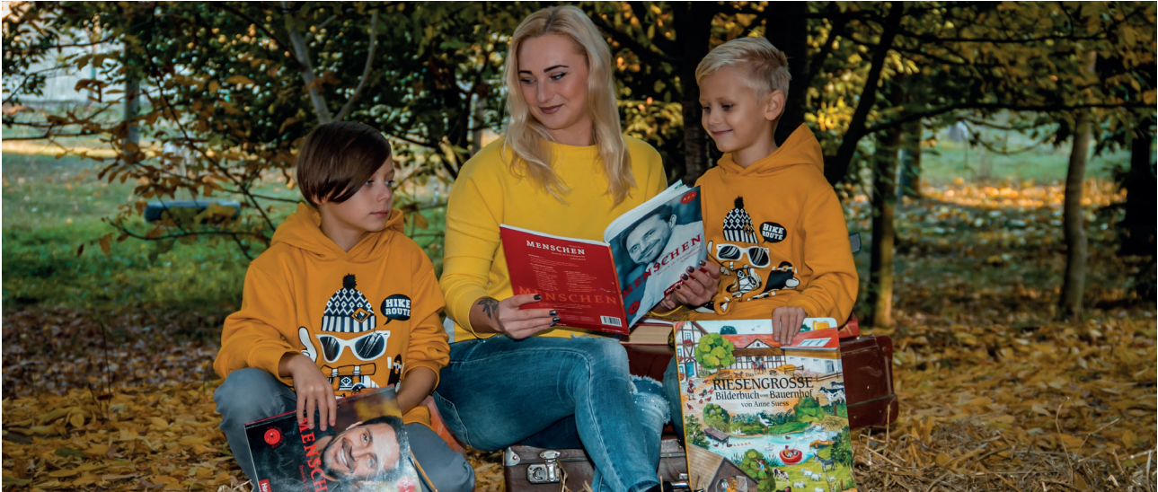
„Deutschlernen mit Spaß!“ Autorin: Natalija Rybar