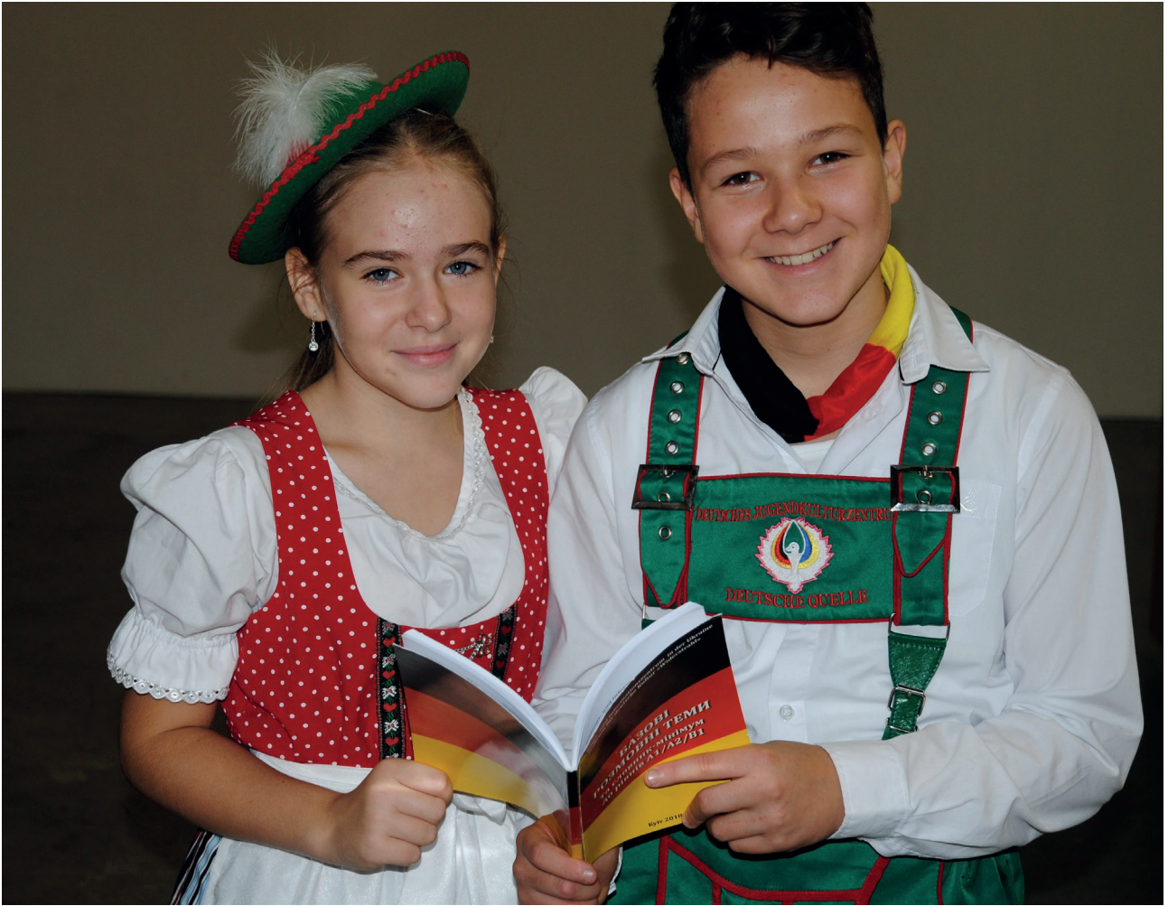
„Süße zwei“ Autorin: Viktorija Leonenko

Die Fortsetzung der Fotoreihe der Gewinner des Wettbewerbes „Fokus auf Deutsch“.