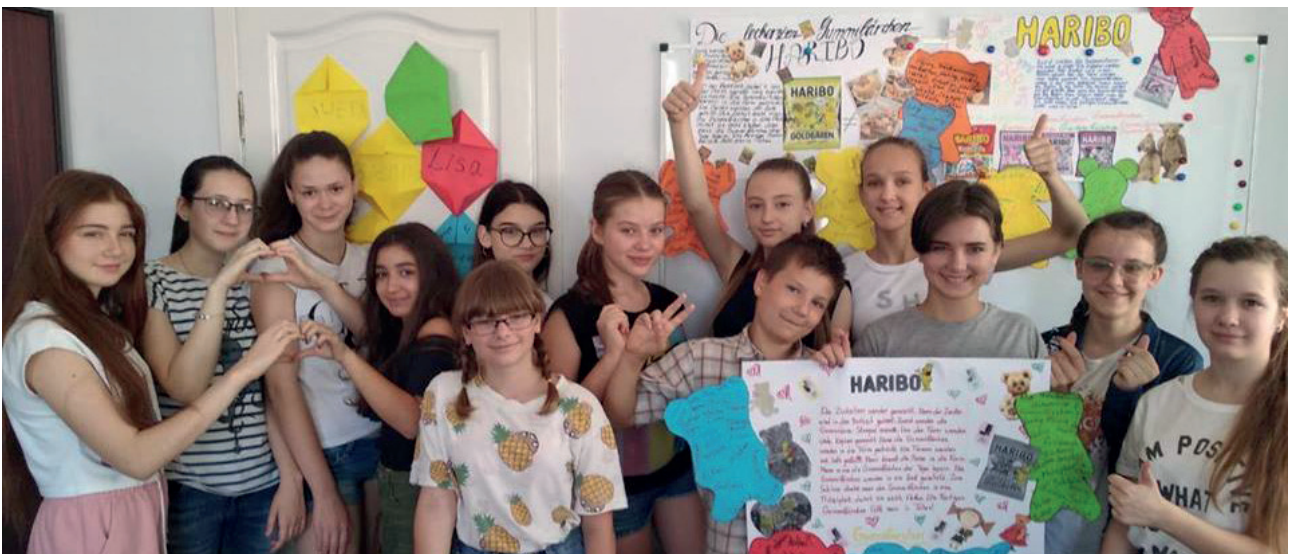
„Deutsch im Sommercamp. Kreativ und lustig“ Autorin: Larysa Dvornikova