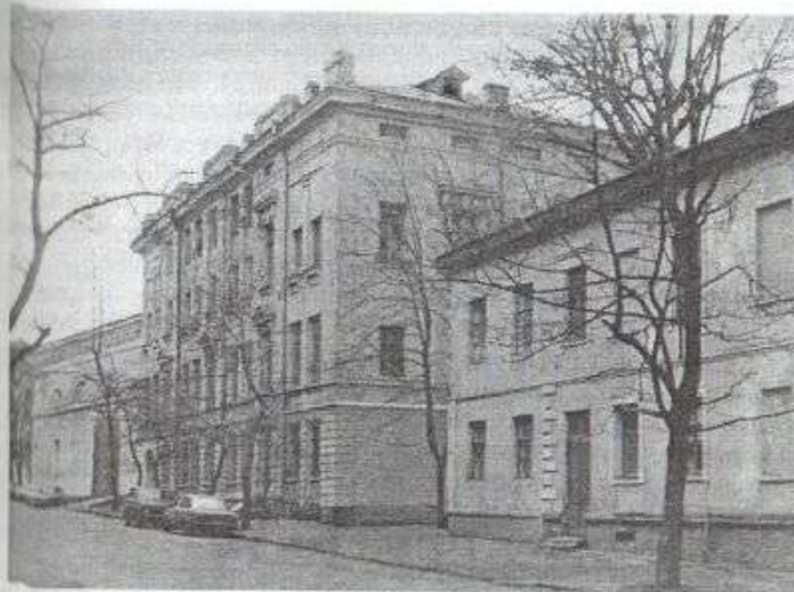
Лютеранская Вознесенская женская гимназия. Перестроена в 1904 году архитектором Ю. С. Цауне

Так, в 1900 году из 362 учениц только 69 были лютеранками. Если изначально всеобщая история, география преподавались по-немецки, то к концу XIX века — по-русски 79 .