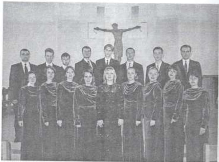
Молодежный хор «Те Деум» в церкви Святой Екатерины (Киев)