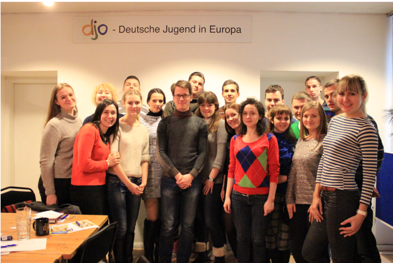
На фото: представители ВО «Немецкая молодежь в Украине»