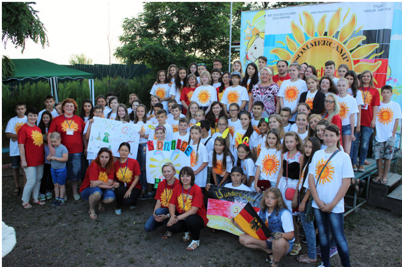
На фото: участники летнего лагеря „DEUTSCH AKTIV“ Am Foto: TeilnehmerInnen des Sommercamps „DEUTSCH AKTIV“

С 7 по 18 июля 2016 года в лагере «Империя детства» в селе Мироцкое Киевской области проходит Всеукраинский языковой летний лагерь для школьников в возрасте от 10 до 15 лет из семей этнических немцев.