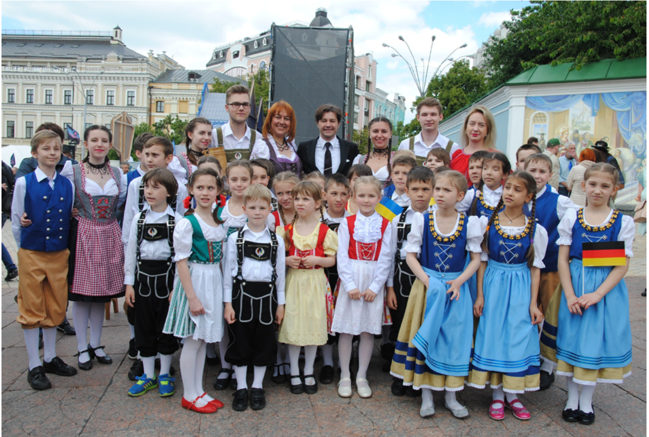
На фото: Министр культуры Украины Евгений Нищук и Народный театр немецкого танца „Deutsche Quelle“ Am Foto: Kulturminister der Ukraine Jewhen Nyschtschuk und das Volkstheater des deutschen Tanzes „Deutsche Quelle“

Am 21-22. März fanden die Europatage in der ganzen Ukraine statt. Dieses Fest wurde von vielen kulturellen Veranstaltungen und Konzerten begleitet. Daran haben einige deutsche gesellschaftliche Organisationen teilgenommen.