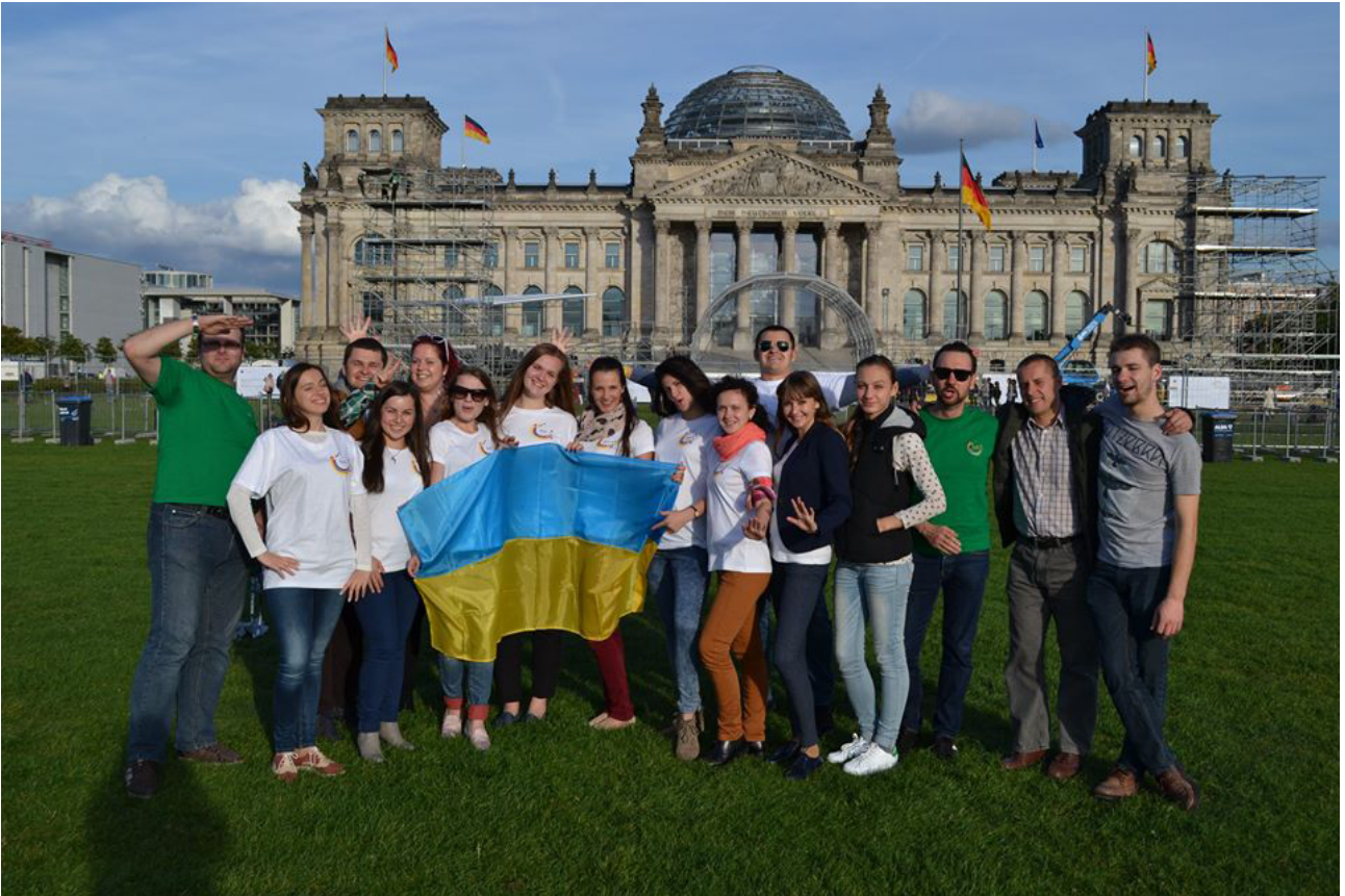
На фото: представители ВО «Немецкая молодежь в Украине»

Am Foto: VertreterInnen des gesamtukrainischen Verbands „Deutsche Jugend in der Ukraine“