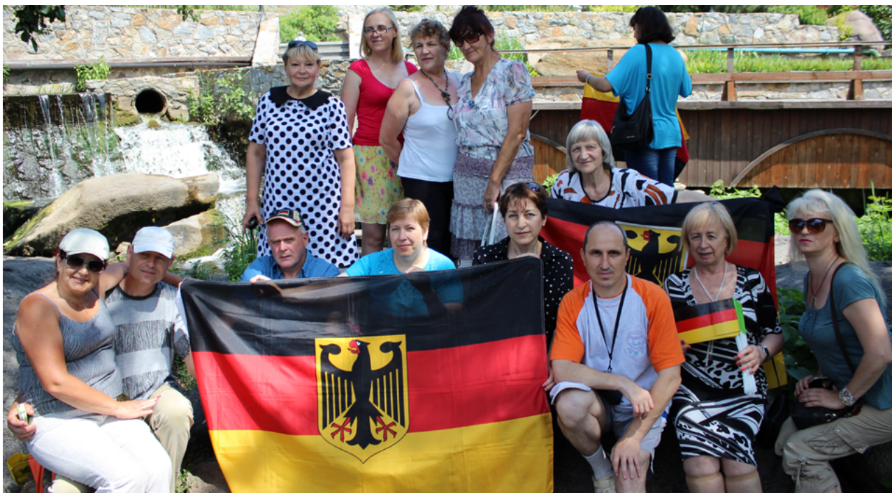
На фото: участники семинара BIZ Am Foto: TeilnehmerInnen des BIZ Seminars

23-26 июня 2016 года в городе Белая Церковь Киевской области состоялся Всеукраинский семинар BIZ на тему «Этнокультурная работа» для руководителей и активистов немецких центров встреч. Все желающие приняли участие в многочисленных мастер-классах, полезных семинарах, а также побывали в живописном ландшафтном парке в селе Буки, поблизости Белой Церкви.