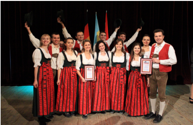
На фото: „Deutsche Jugend Lemberg” Am Foto: „Deutsche Jugend Lemberg”

С мая 2016 года на Портале немцев Украины открылся новый раздел «Творческие коллективы», в котором представлена информация о немецких танцевальных, вокальных и театральных группах, существующих на территории Украины. В данной рубрике размещена основная информация о коллективе, руководителях, направлении работы и достижениях группы. Красочные фотографии и видеосвыступлений ставят финальный аккорд в создании небольшого портфолио на Портале немцев Украины.