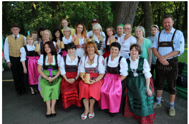
На фото: участники семинара BIZ Am Foto: TeilnehmerInnen des BIZ Seminars

мы будем петь, танцевать, и планируем посетить Александрийский парк».