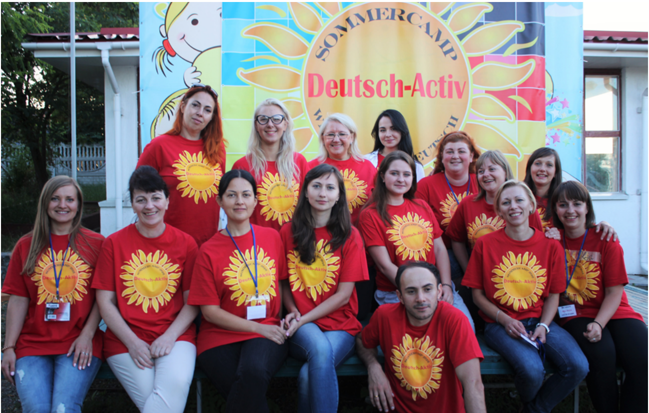
На фото: преподаватели летнего лагеря „DEUTSCH AKTIV“ Am Foto: LehrerInnen des Sommercamps „DEUTSCH AKTIV“

Естественно, вечерняя программа не менее насыщена, чем дневные занятия. Дискотеки, конкурсы, культурные вечера – все это подарит незабываемые впечатления и заставит с