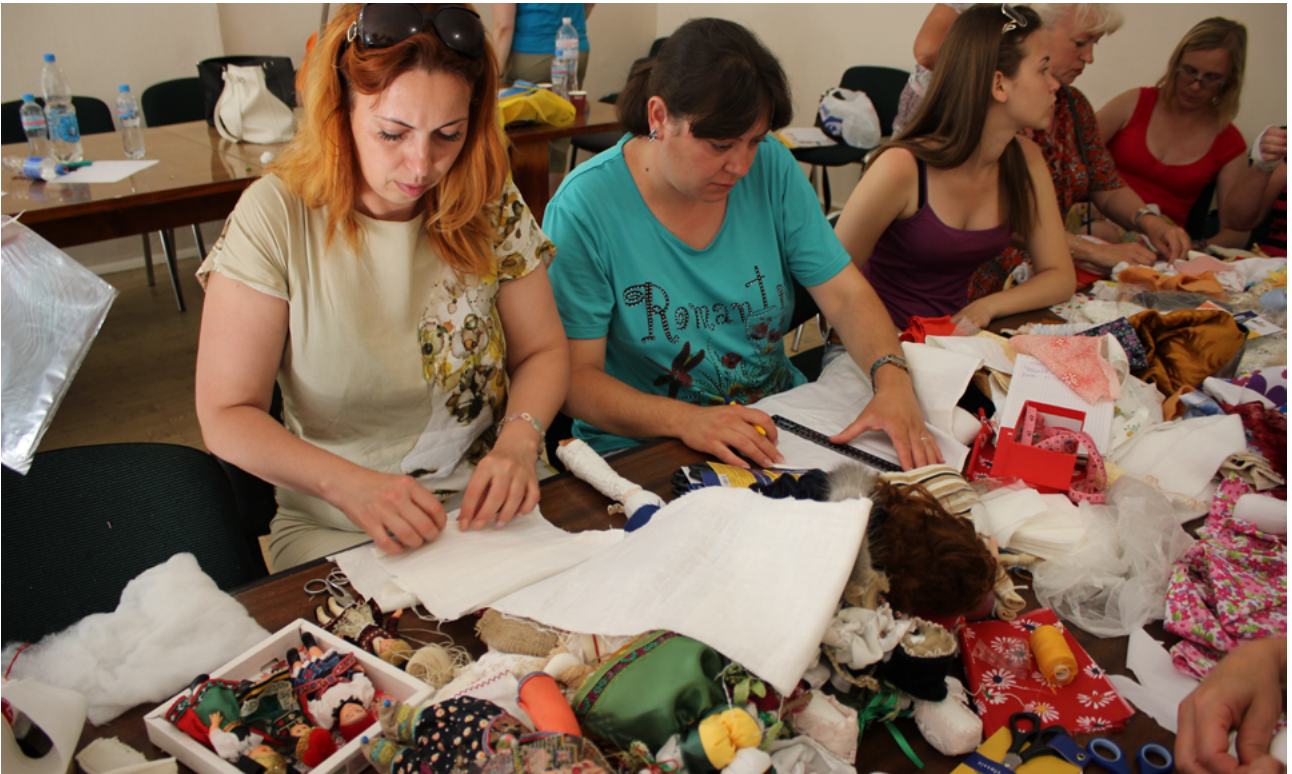
На фото: участники семинара BIZ на мастер-классе по изготовлению немецкой куклы Am Foto: TeilnehmerInnen des BIZ Seminars beim Kreativ-Workshop für Kunsthandwerk

Участники самостоятельно устраивали образовательные конкурсы и викторины, тем самым мотивируя друг друга изучать культуру и традиции Германии. С особой активностью представители немецких организаций принялись за пошив настоящей немецкой куклы, а национальные костюмы и традиционные танцы помогли окончательно окунуться в немецкоязычную среду и почувствовать дух немецких праздников.