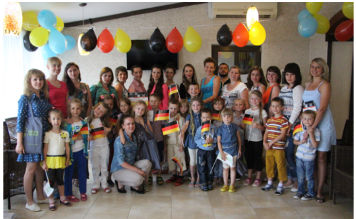
На фото: Участники проекта „Familiensprachschule“ Am Foto: TeilnehmerInnen des Projektes „Familiensprachschule“

С 20 по 29 июля 2016 года в живописном поселке Сходница Львовской области прошел образовательный проект «Familiensprachschule», целью которого было создать уникальный формат летней семейной языковой школы для детей дошкольного возраста.