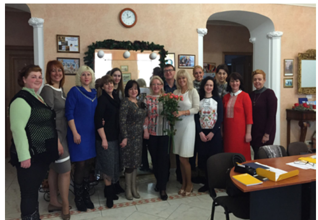
На фото: мультипликаторы BIZ Am Foto: BIZ-MultiplikatorInnen

Мультипликаторы BIZ открыты к сотрудничеству и будут рады провести локальные семинары по своей специальности.