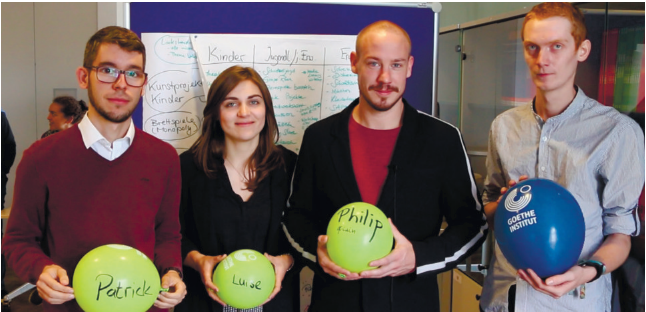
Foto: Vier SprachassistentInnen des Goethe-Instituts

Anfang Oktober begannen die neuen SprachassistentInnen des Goethe-Instituts ihre Tätigkeit an den Zentren der deutschen Minderheiten in der Ukraine. Die vier jungen Leute werden in den Städten Kyjiw, Mukatschewo, Saporischja und Cherson arbeiten.