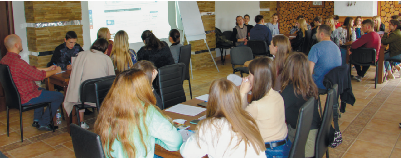
Teilnehmende des Forums

Vom 3. bis zum 6. Oktober 2019 fand in der Nähe von Lwiw das Gesamtukrainisches Jugendforum statt. An dem Forum nahmen etwa 50 junge Menschen aus der ganzen Ukraine teil, sowohl Mitglieder des koordinierenden Rates der DJU, als auch aktive Jugendliche von deutschen gesellschaftlichen Organisationen, Initiativen und Vereinen der Ukraine.