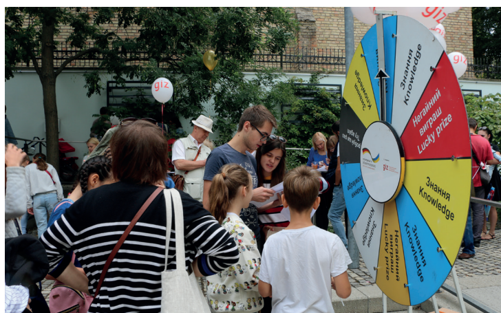
Fotos: Besucher und Organisatoren der Veranstaltung

Außerdem gab es umfangreiche Informationen zu Studien- und Austauschmöglichkeiten nach Deutschland gefolgt von den Ständen der Stiftungen. Denn sowohl die Heinrich-Böll Stiftung als auch die Konrad Adenauer- und die Hans Seidel Stiftung haben Ableger in Kiew, die Seminare zu politischer Bildung, Demokratieentwicklung, Erinnerungskultur und Energiethemen anbieten. Die Angebote wurden durch Quiz-Spiele und kleine Vorträge sehr interaktiv gestaltet.