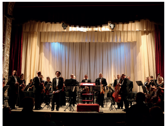
Fotos: Aufführungen der eingeladenen Gäste in der Philharmonie