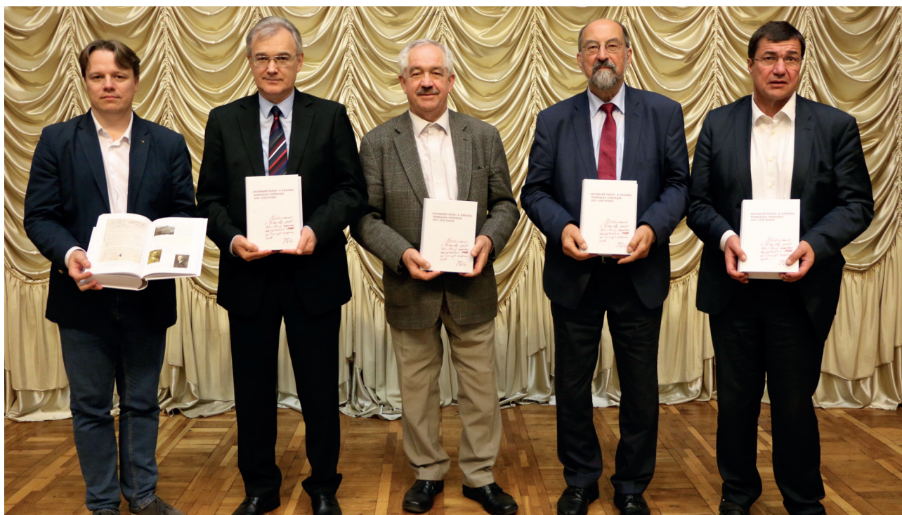
Foto: Autoren des Buches mit Gästen der Veranstaltung