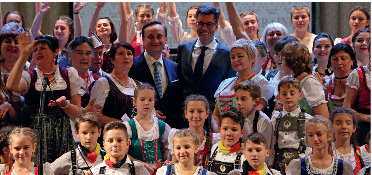
Fotos: Auftritte der Teilnehmenden