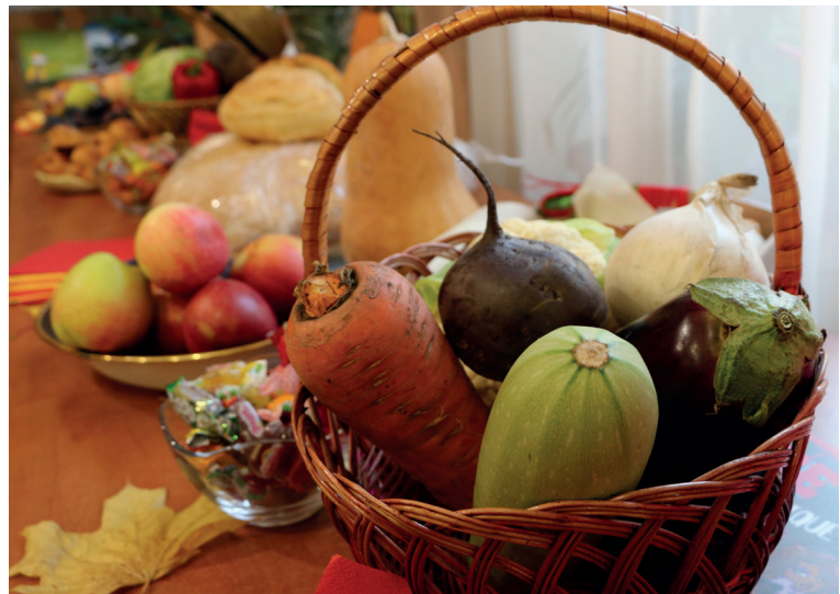
Foto: Traditionelles Obst und Gemüse

Im Rahmen des Erntedankfestes finden Gottesdienste statt, bei denen Erntekronen und mit Früchten gefüllte Körbe den Altarraum schmücken. Die Erntekronen werden mit geflochtenen Ähren gebunden und mit Feldfrüchten dekoriert. Einige Gemeinden zelebrieren die Feierlichkeit zudem mit Tänzen und Festessen.