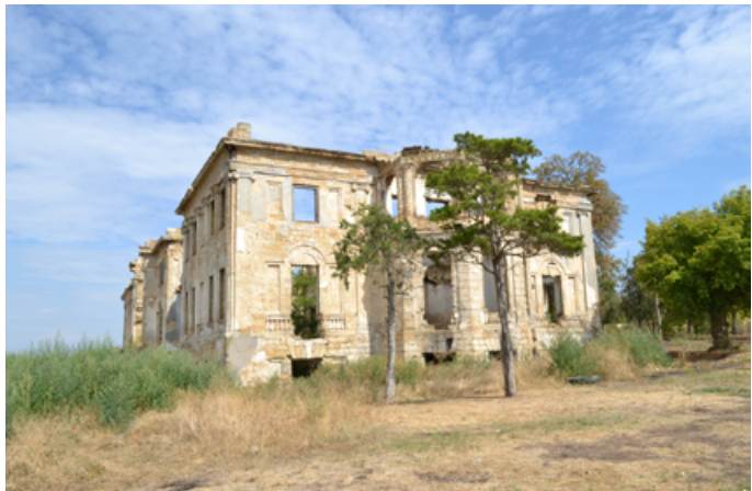
Foto: ehemalige deutsche Kolonien des nördlichen Schwarzmeerraums

„Die Deutschen, wie richtige Landwirte, haben die südlichen Gebiete erschlossen, obwohl es ihnen anfangs sehr schwer fiel. Es gab Ackerbauer, Weinbauer, Gärtner und Handwerker. Durch beharrliche Arbeit gelang es ihnen, das wilde Kutschurhan Gebiet mit der sandigen Erde und dem regenarmen Klima in eine grüne Oase zu verwenden.“