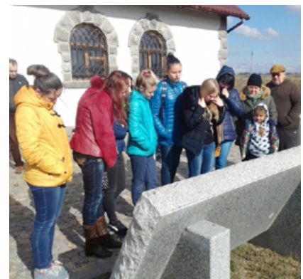
Foto: TeilnehmerInnen des Spieles beim Grabdenkmal

Danach folgten die Seminare, wo sich die Teilnehmer über die Antragsbesonderheiten der Ausschreibung in den ukrainischen Fonds erkundigen konnten.