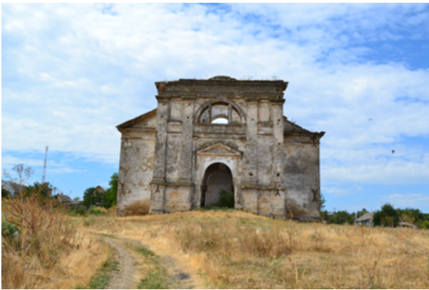
Foto: ehemalige deutsche Kolonien des nördlichen Schwarzmeerraums