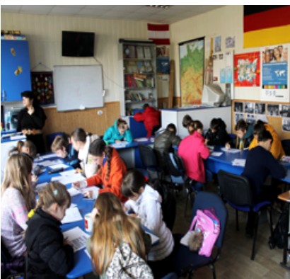
Foto: TeilnehmerInnen der Deutscholympiade

Am ersten Tag nahmen die Kinder und Erwachsenen mit den Grundkenntnissen auf dem Niveau A1, A2 teil. Am nächsten Tag haben sich jene angemeldet, die schon Deutschkenntnisse auf dem Niveau B1 besitzen.