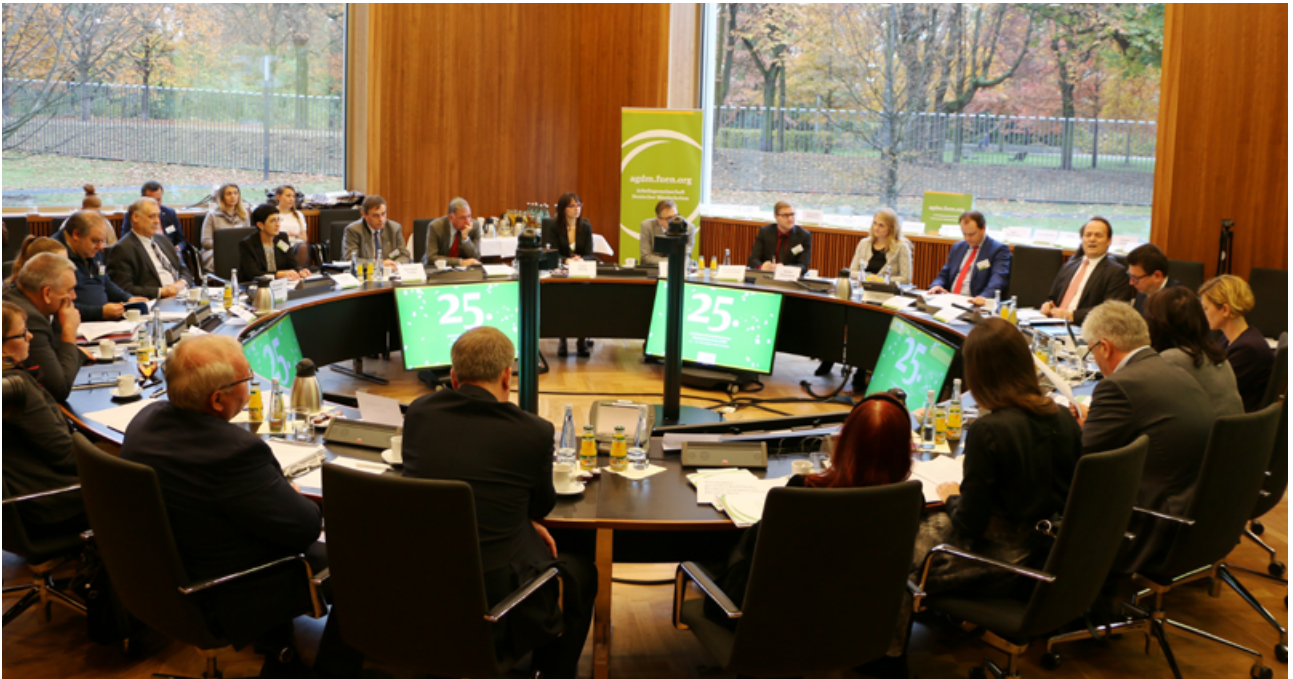
Foto: Sitzung der Arbeitsgemeinschaft Deutscher Minderheiten

Vom 7. bis 10. November 2016 fand in Berlin die 25. Jahrestagung der unter dem Dach der Föderalistischen Union Europäischer Nationalitäten (FUEN) wirkenden Arbeitsgemeinschaft Deutscher Minderheiten (AGDM) statt. Über 50 Vertreter von 29 Minderheitenorganisationen aus 19 europäischen Ländern treffen sich zu dieser Veranstaltung. Im Rahmen der diesjährigen Tagung empfing die Bundeskanzlerin Angela Merkel die Vertreter der deutschen Minderheiten Europas im Bundeskanzleramt.