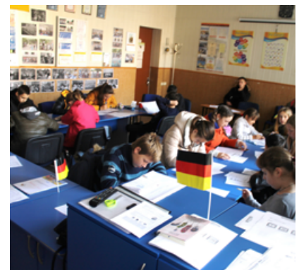
Foto: TeilnehmerInnen der Deutscholympiade

Die Deutschkursbesucher haben eigene Stärken und Schwächen festgestellt, und eine objektive Einschätzung ihrer Kenntnisse bekommen.