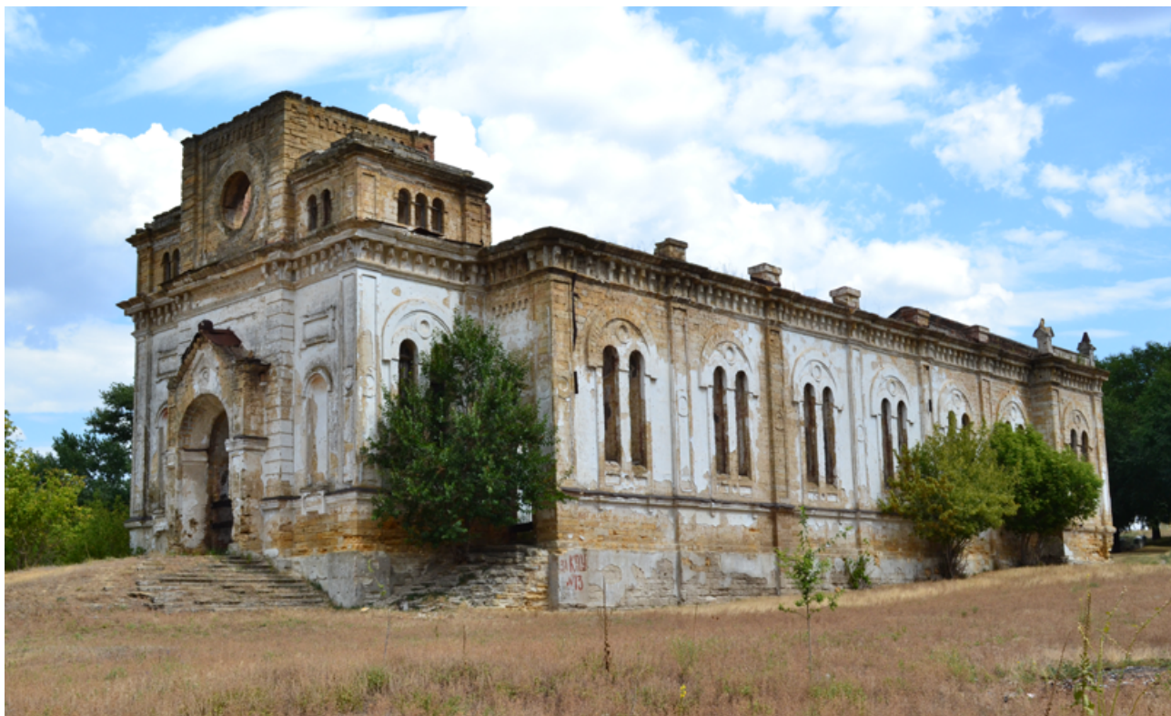
Foto: ehemalige deutsche Kolonien des nördlichen Schwarzmeerraums

Vom 15. bis zum 19. August 2016 wurde ein Projekt „Expedition der deutschen Künstler der Ukraine in die ehemaligen deutschen Kolonien des nördlichen Schwarzmeerraums“ vom Nikolajewer „Deutschen Kultur- und Begegnungszentrum“ durchgeführt.