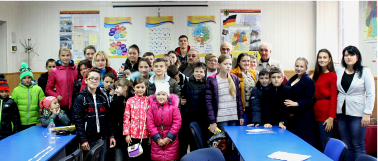
Foto: TeilnehmerInnen der Deutscholympiade

Eine andere Veranstaltung fand am 22.-23. Oktober ebenfalls in Kirowograd statt. Die regionale Deutscholympiade fand Beachtung bei vielen Deutschlernenden.